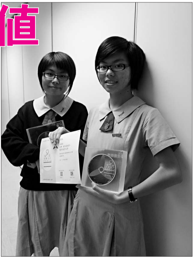
文化考察報告獎高級組的角逐，最終奪得三個獎項

開始已知道這是一份很不容易的工作。但想不到的是，完成報告的過程比她想像中更困難。「升上高中，新的科目、繁多的功課都令我學業壓力更加沉重，加上這個研習只是由我和妹妹去參與完成，真是令人煩惱。」她認為：「『時間代價』是我升上了中四才認識的詞彙，所以這個題目對讀中二的妹妹來說一定有些難度，我只得一路帶領着她去探索這條連我也摸不清的道路。」