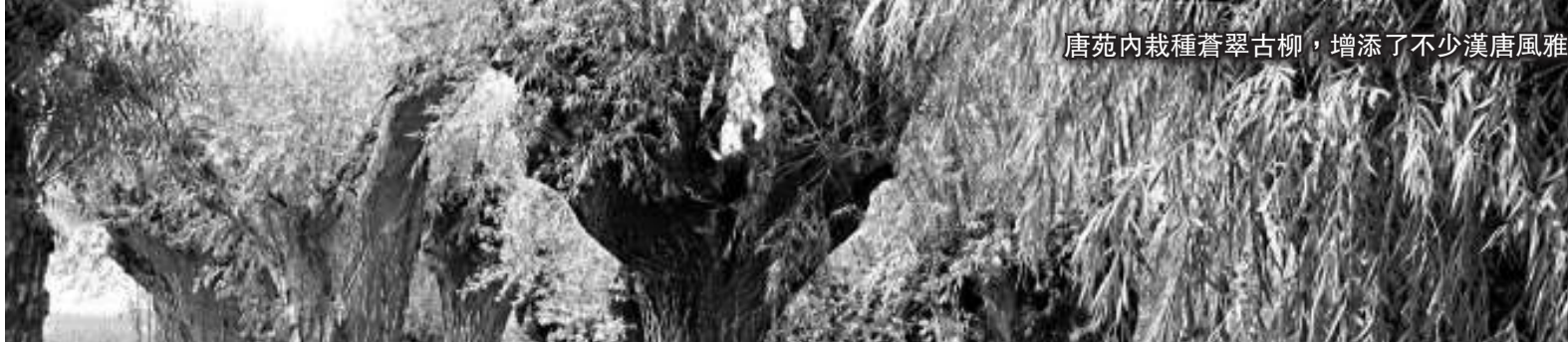
唐苑內栽種蒼翠古柳，增添了不少漢唐風雅

除了珍稀的古木奇樹外，唐苑還蒐集了數以萬計的園林巨石、庭堂奇石，甚具觀賞價值，圖為其中一塊紋理如流水行雲的巨型奇石