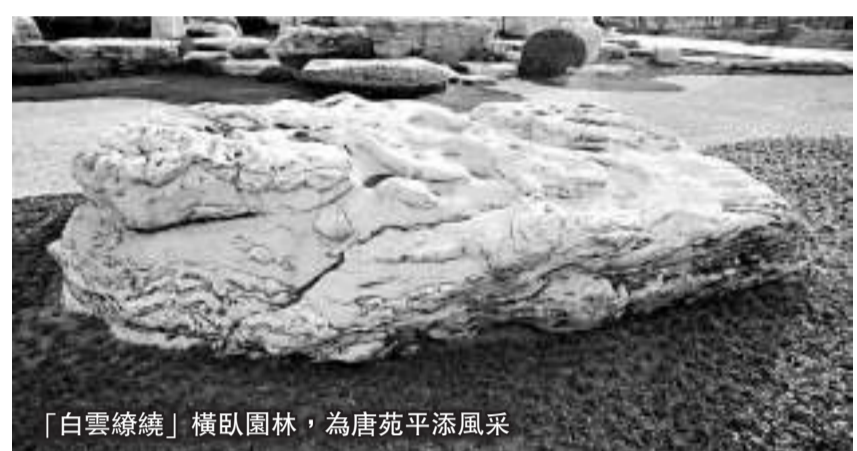
「白雲繚繞」橫臥園林，為唐苑平添風采