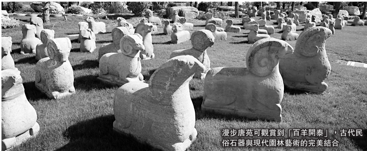
漫步唐苑可觀賞到「百羊開泰」，古代民俗石器與現代園林藝術的完美結合

中國唐苑於2008年10月1日舉辦了「首屆中國唐風盆景展」，取得了巨大成功，贏得了業界人士和社會各界人士的交口讚譽。我們誠摯地邀請國內外賞石界的各位朋友，相約古城、相約唐苑、增進友誼、加強交流，值新春佳節之際，分享奇石藝術盛宴！（首屆中國唐風奇石博覽會組委會）