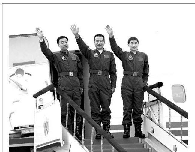
「神七」航天员翟志剛（中）、劉伯明（右）、景海鵬（左）下個月來港，本港中小學生有機會與他們會面（資料圖片）

逗留三個月，與本地學者合作，其餘時間將以視像形式與本地學者溝通，部分學者更會在稍後時間全職留在理大。另外，理大將邀請國際知名學者到校交流，近日邀得避孕藥之父卡爾·翟若適來港。 陳新滋表示，現時理大全校約有八百多位研究生和博士後學生，期望在大學四年制推行時，將名額增至一千二百個，約佔全校學生比例一成；校方將以補貼形式，資助三分之一經費予教授招收研究生，又會鼓勵本科生參加研究。