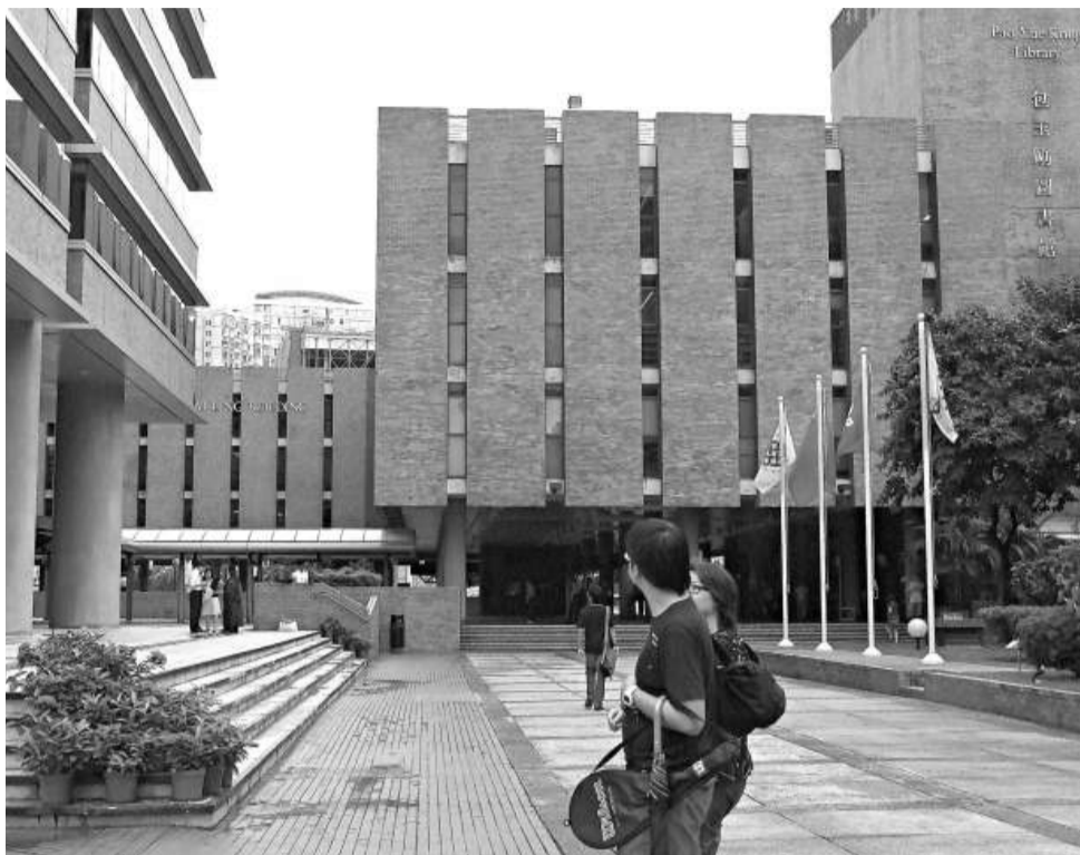
理大致力發展科研，投入巨資聘請優秀教授

不過，要全職聘請這批學者有難度，而理大亦要待大學四年制推行，才有足夠實驗室供該批學者使用。因此現時以「半職制」延聘這批學者，他們每年將在理大