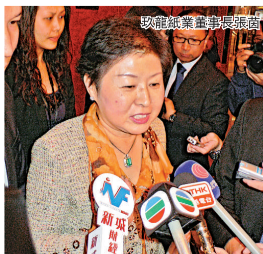
玖龍紙業董事長張茵

環球經濟步入衰退，評級機構及投資銀行均憂慮紙業股價高築，玖龍紙業(02689)董事長張茵表示，隨着人民幣重貶減息，將對集團整體帶來幫助，又預期集團09年負債水平將不會高於今年。