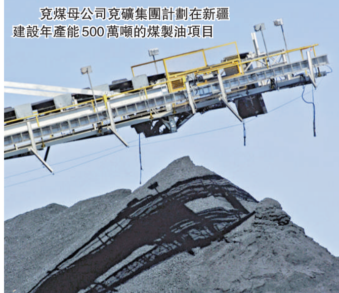
兗煤母公司兗礦集團計劃在新疆建設年產能500萬噸的煤製油項目

除山西天浩化，兗州還擁有「兗州煤業榆林能化」。該項目首期設計產能60萬噸甲醇，並正進行第二期項目的可行性研究，預算產能甲醇年產能180萬噸、丙烯80萬噸。