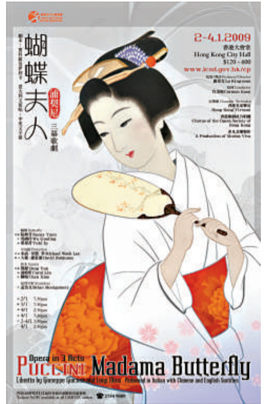
《蝴蝶夫人》講述日本藝妓與美國海軍的異國情緣

節目另設多場演出前講座（粵語），由盧景文主講，免費入場，座位先到先得，詳情如下：十二月十三日（星期六）下午三時，香港藝術館演講廳，講題：《蝴蝶夫人》的創作與誕生；十二月二十日（星期六）晚上七時半，香港文化中心音樂廳後台七樓一號排練室，講題：《蝴蝶夫人》與浦契尼的音樂創作歷程；十二月二十七日（星期六）下午三時，香港藝術館演講廳，講題：《蝴蝶夫人》的策劃和製作。