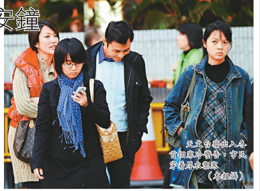
天文台發出入冬首個寒冷警告，市民穿著厚衣服禦寒

民政事務總署昨日開放十個臨時避寒中心，開放時間為下午五時半至翌日早上八時半。十個避寒中心位於西營盤社區綜合大樓、銅鑼灣社區中心、土灣灣街坊福和會、慈雲山(南)社區中心、南昌社區中心、油麻地梁顯利油麻地社區中心、大埔社區中心、梨木樹社區會堂、朗屏社區會堂及屯門蝴蝶灣社區中心。市民可致電 28351473 查詢。