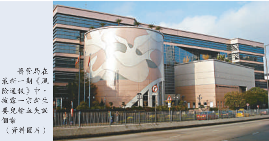
醫管局在最新一期《風險通報》中，披露一宗新生嬰兒輸血失誤個案(資料圖片)

《風險通報》內還披露四宗遺留醫療儀器、用品及紗布在病人體內的個案。一名病人因交通意外骨折要進行固定手術，手術後遺留了一件小型手術工具在體內，病人七個月後感到不適求醫，在照 X 光後才發現這件工具，要再施手術將工具取出。另外一名病人切除扁桃腺手術後七日出血，X 光檢查發現傷口留下一塊紗布，要用手術鉗將紗布取出。另有一宗是一名曾中風的病人接受吸痰時，遺留了一段十點五厘米的吸管在左鼻孔，可能是病人接受吸痰時咬斷留低。