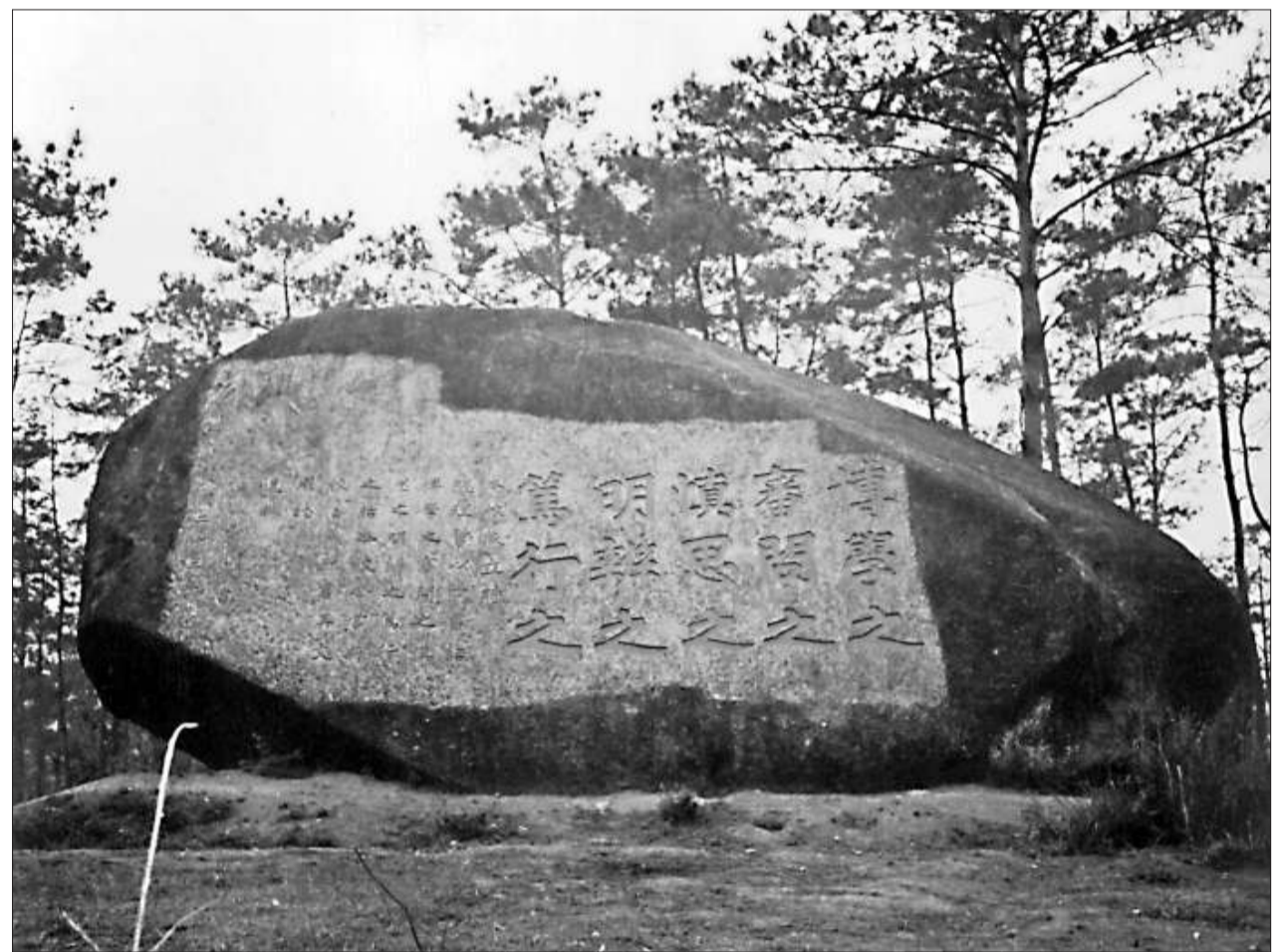
孫中山題詞刻石原貌

書》裡與此十五字「遺教」相關的文字是《中庸》第二十三章之末節，但題詞與《中庸》此文詳略迥異，而與朱熹《白鹿洞書院學規》第二項則完全雷同。我疑題詞不是直接取自《中庸》，而是取自朱熹《白鹿洞書院學規》。 朱熹是歷史上傑出的思想家、教育家，他以畢生精力從事學術研究，和教育實踐，為教育事業作出重要貢獻，他修復了號稱《四大書院》的白鹿洞書院和岳麓書院，創建著名的考亭書院、紫陽書院、晦庵書院、建安書院等，他教過的弟子數以千計。對教育事業的貢獻，以修復白鹿洞書院，影響最為深遠。 白鹿洞書院是朱熹到江西南康擔任行政主管「知軍」時復辦的。關於白鹿洞書院的來歷及修復經過，朱熹文集《白鹿洞賦》及報告朝廷的《申修白鹿洞書院狀》和移文地方官員的《白鹿洞牒》皆有言及。 白鹿洞書院原址在廬山五老峰下，原是唐朝名士李渤、李涉兄弟隱居讀書之所，李渤養有一隻白鹿，被人稱為白鹿先生，所住之地也就被人稱為白鹿洞。李渤後來出仕，曾任江州刺史，有能力在白鹿洞加建樓台亭榭，雜植花木，成為廬山一個勝景。唐朝亡後的五代時期，江西是南唐小朝廷轄境，南唐小朝廷頗能關心文化教育，把白鹿洞