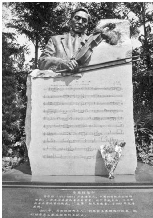
廣州聚芳園內的馬思聰塑像