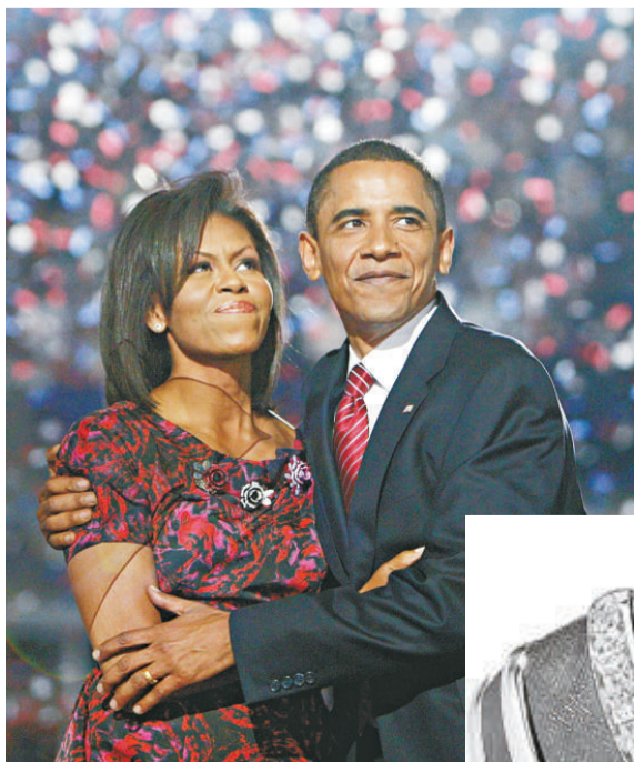
▲奧巴馬要送給愛妻名貴戒指以示感謝

【本報訊】據英國《每日郵報》網絡版一日消息：意大利一位珠寶設計師的發言人透露，美國總統當選人奧巴馬準備向妻子米歇爾送贈一枚價值二萬英鎊的名貴戒指，以答謝她在選舉期間對他的支持。米歇爾將會收到的「和諧」戒指，屬全世界最昂貴金屬最珍貴金屬之一鑄製造，外層鑲嵌了鑽石。它由意大利設計師博斯科為配合一月奧巴馬的總統就職典禮趕工製造。