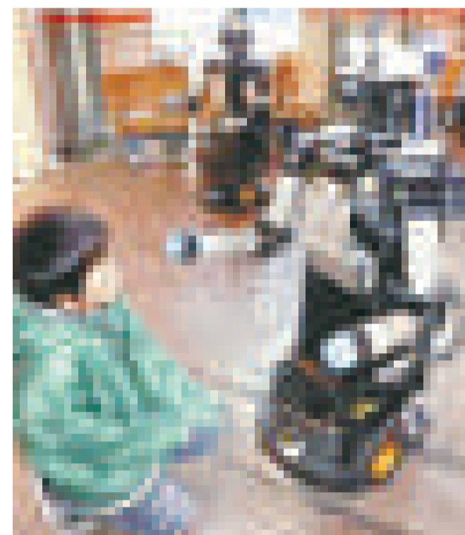
▲日本的機器人導購員

機器人間互相通過網絡連接，ATR的網絡機器人研究室長秋本高明表示「若將來能做出只有機器人的商店，一定很有趣」。