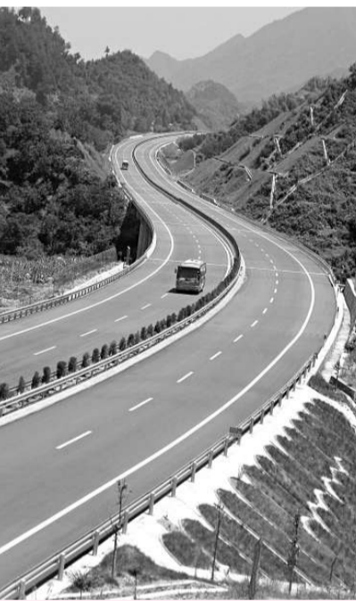
高等級公路已深入到內陸省份

【本報記者井欽聞深圳一日電】由深高速投資控股、清連高速公路上3座特大高架橋主體工程相繼建成，並在高達100多米的「華南第一高橋」陽山杜步1號大橋上舉行了杜步特大橋全橋合龍慶典，標誌著清連高速公路三大控制性工程順利完工，為12月底按期完工通車提供了保證。