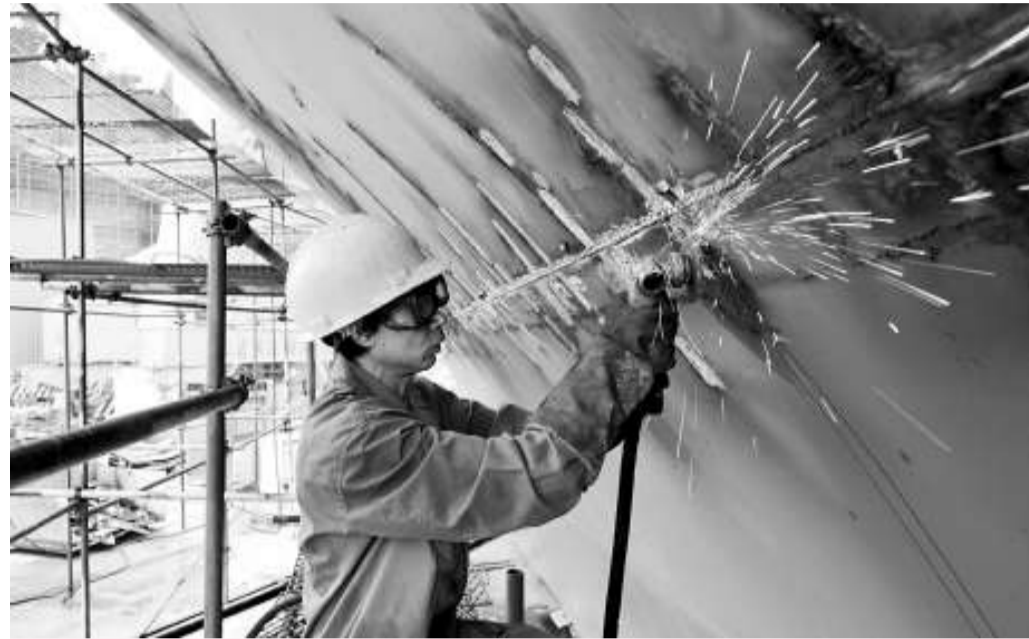
江西省九江市已經形成88萬載重噸的設計造船能力，123萬載重噸的設計造船能力正在建設中。規模以上造船企業15家

業內普遍認為，更多的銀行將隨之關閉船舶融資借貸的大門，但船舶融資市場崩盤面不大可能發生。根據預測，目前全球船舶債務融資額高達3400億美元，至2010年股票融資額將高達2000億美元。