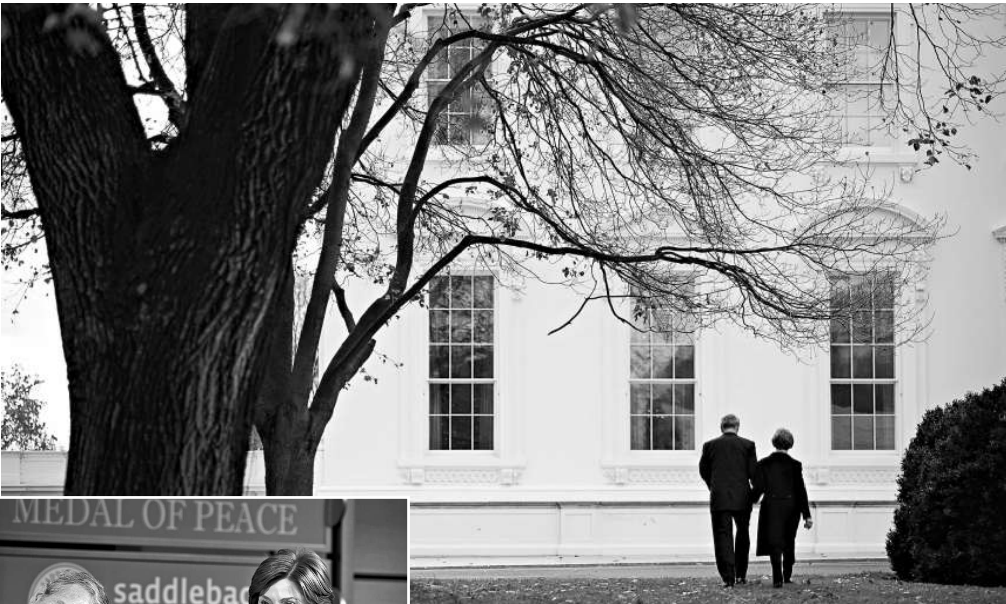
▲布什的任期尚餘七周。圖為他與妻子勞拉走在白宮草地上