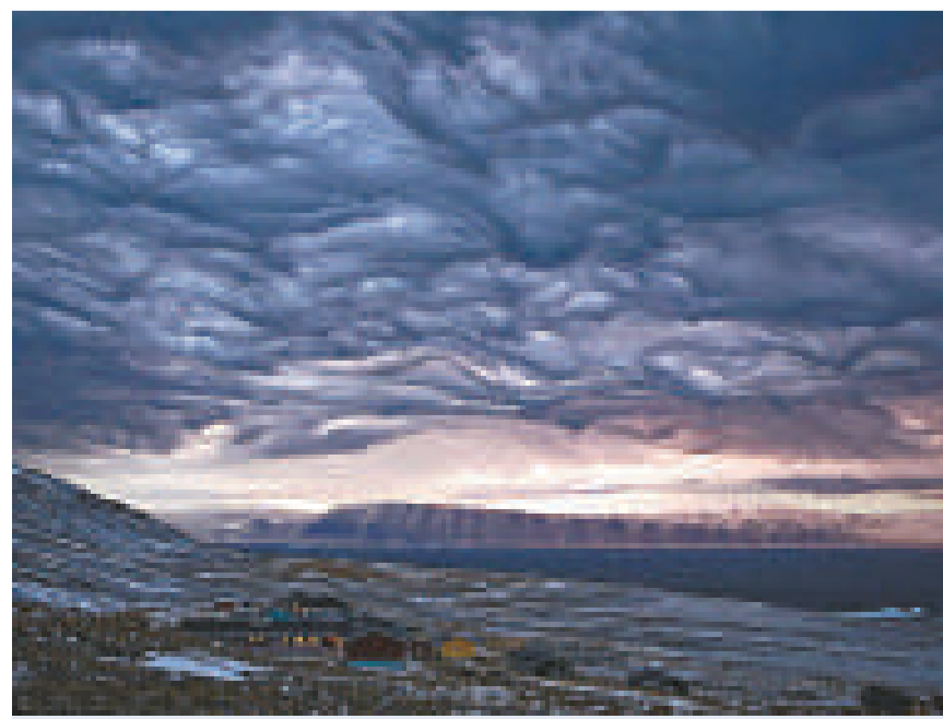
▲「末世景象」其實是格陵蘭島的冬季日出

英國氣象局解釋說：「你經常會看見雲層對下面的地形依樣畫葫蘆，風由其中一方吹來，被引到山上的上空，吹動雲層，最後才落下。這是「山嶽效應」的一個特別例子。」