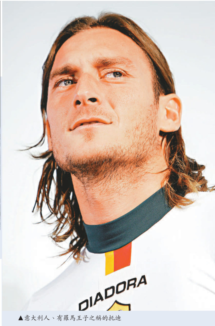
▲意大利人、有羅馬王子之稱的托迪