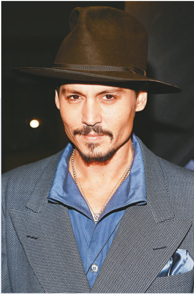
▲美國影星文特沃斯·米勒