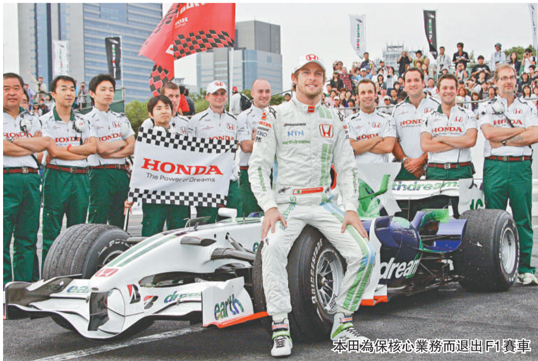
本田為保核心業務而退出 F1 賽車

正當瀕臨破產邊緣的美國汽車業三巨頭，苦苦尋求聯邦政府的資金支持，以期渡過難關之際，日本第二大汽車廠，本田汽車公司行政總裁福井威夫 (Takeo Fukui) 昨日表示，公司將退出一級方程式賽車 (F1)，旗下的 F1 車隊正式出售。此舉將為本田縮減 200 億日圓，約合 2.16 億美元的成本支出。