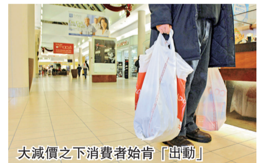
大減價之下消費者始肯「出動」

美國消費開支由 10 月起下跌，延至 11 月初，到感恩節期間才出現反彈。分析員相信，未來 3 周零售商必定繼續大平賣，吸引顧客，整個零售業大減價促銷，減幅是多年來罕見。就算「黑色星期五」銷情出乎意料地好，但 11