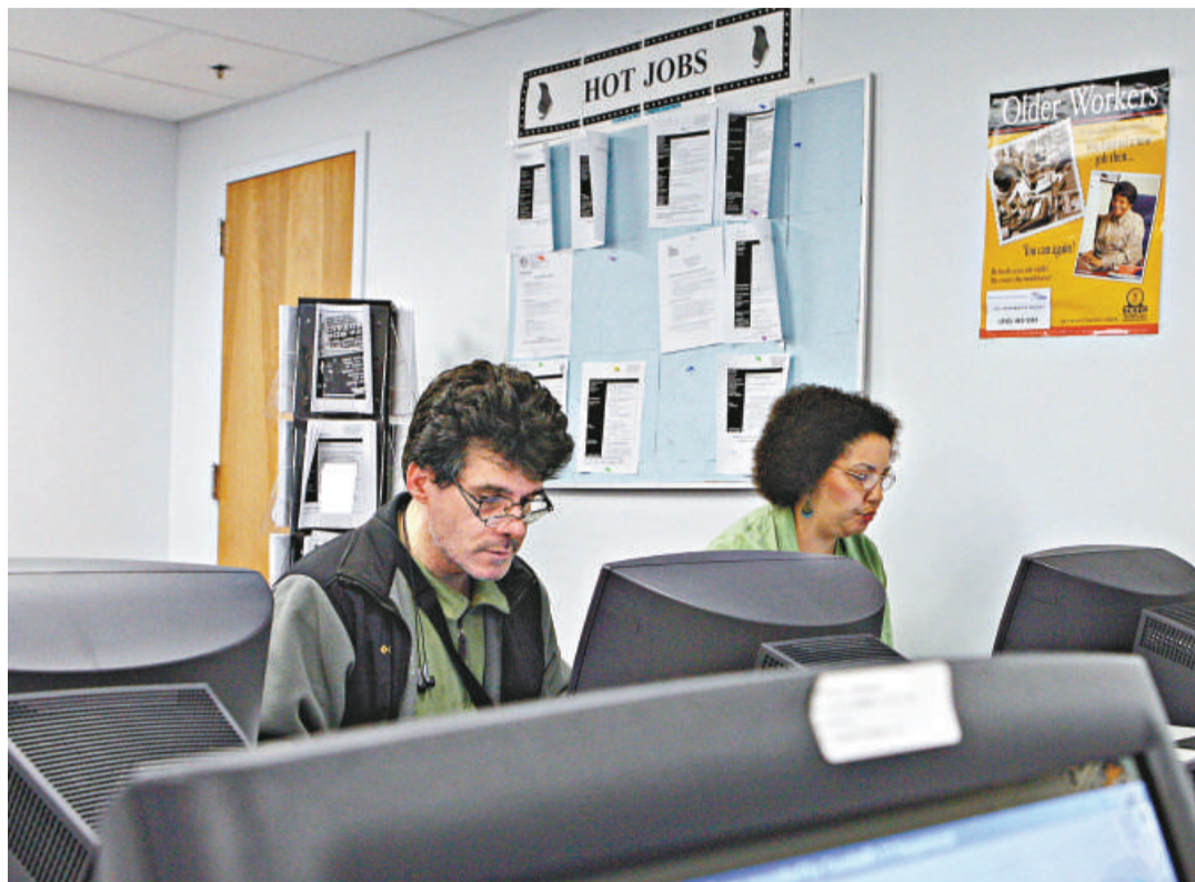
就業職位大減之下，美國經濟衰退日益惡化

在金融海嘯的影響下，美國人對於辦公室的需求大幅減少，尤其是比較大的市場。其中一個重災區應是曼哈頓，該地區共有 3.95 億平方呎的辦公室面積，規模比起芝加哥、華盛頓、波士頓和三藩市等地都要大，而且主要靠金融界來支撐，原因是這些地區擁有較高價的辦公室面積。