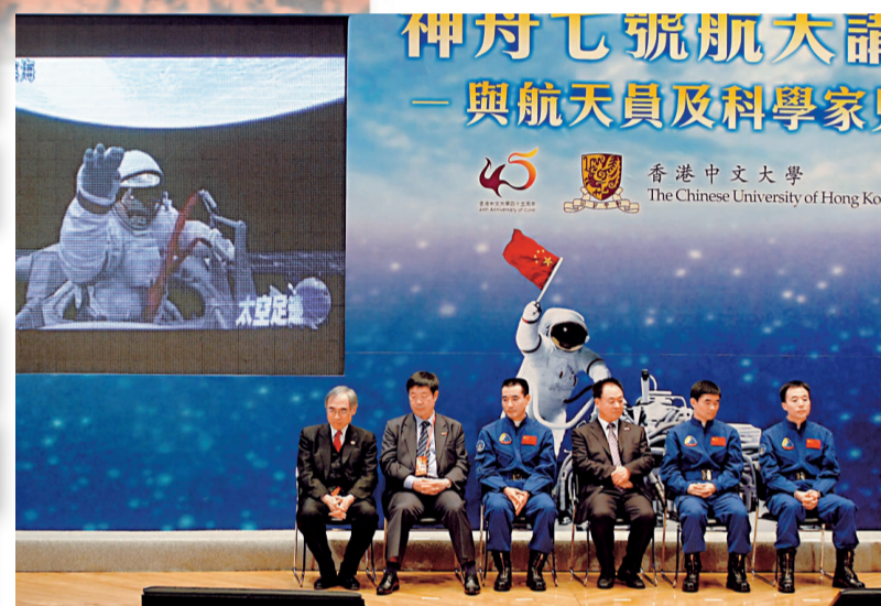
▲「神七」三雄與大學生分享飛行經歷，激勵大學生堅持不懈，努力奮鬥

神舟七號載人航天飛行代表團前日在香港機場「出艙」後，昨日下午來到香港中文大學「太空漫步」，與本港八大院校的大學生展開「天馬行空」的交流。代表團團長張建啓鼓勵本港大學生追求卓越理想，為祖國振興做貢獻。「神七」三雄翟志剛、劉伯明和景海鵬與大學生分享飛行經歷，激勵大學生堅持不懈、努力奮鬥。