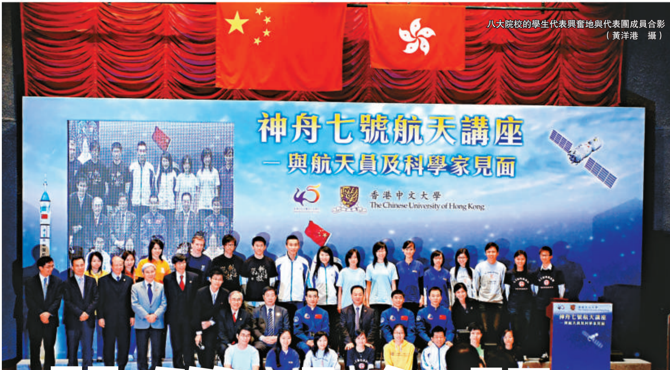
八大院校的學生代表興奮地與代表團成員合影