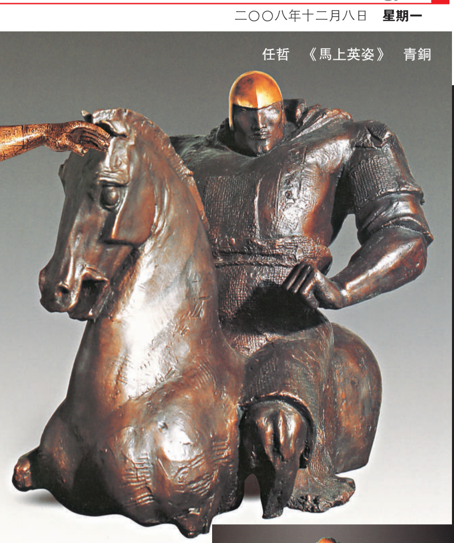
任哲 《馬上英姿》 青銅