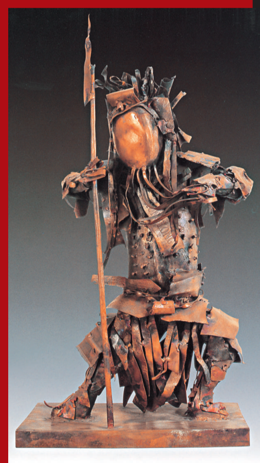
焦興濤 《門神》 紫銅