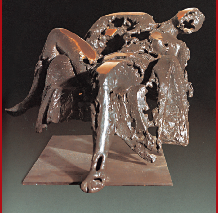
張峰 《辦公室的陽光》 青銅