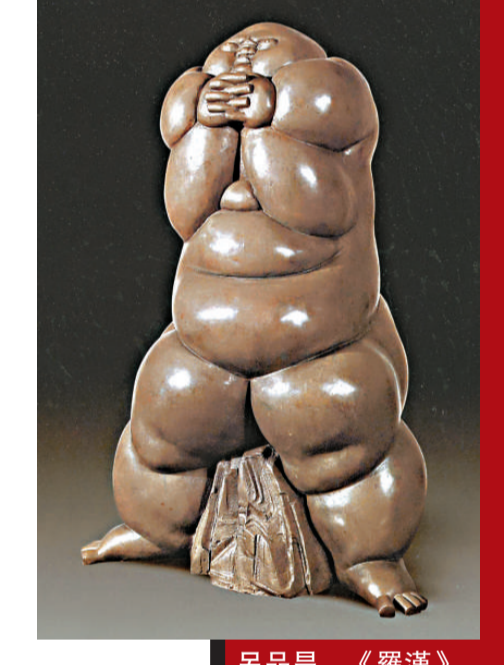
呂品昌 《羅漢》 青銅