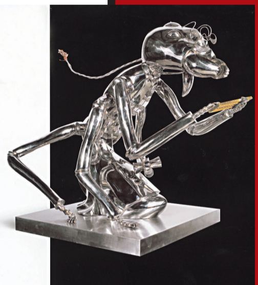
陳志光 (1963) 《帳房先生》