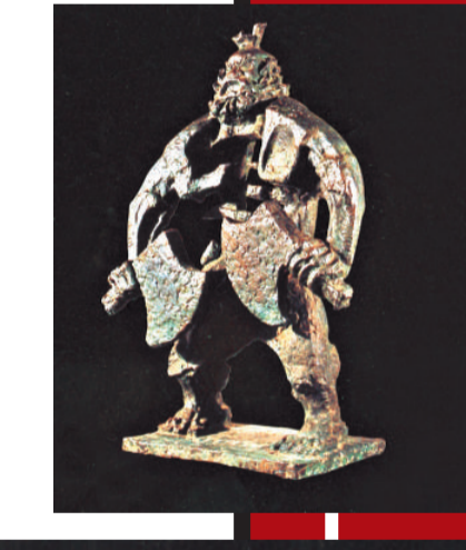
《梁山好漢系列》(銅) 曾成鋼(一九六〇年)