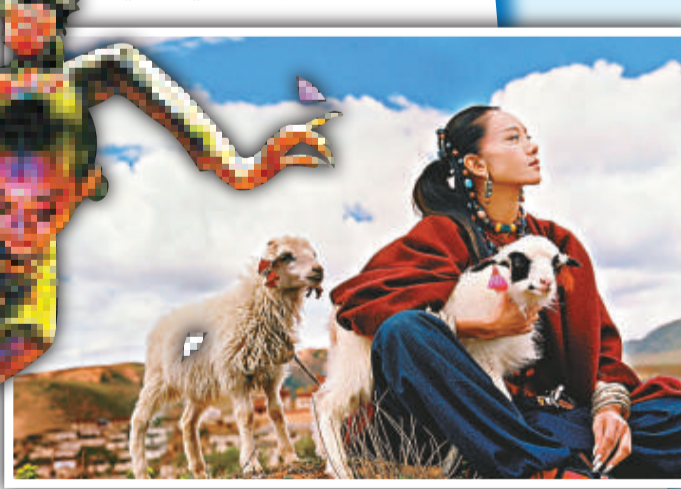
楊麗萍認為只要認真做，觀眾會接受原生態藝術