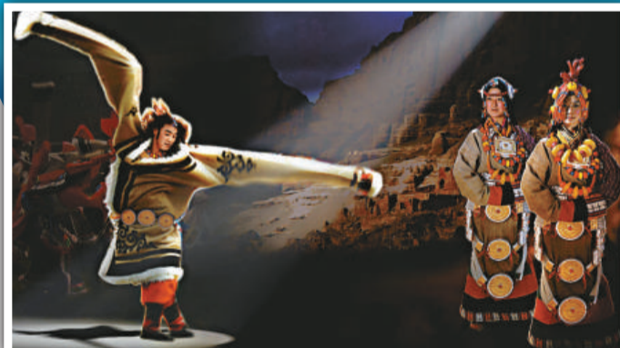
《藏謎》的服飾搜集自西藏各地