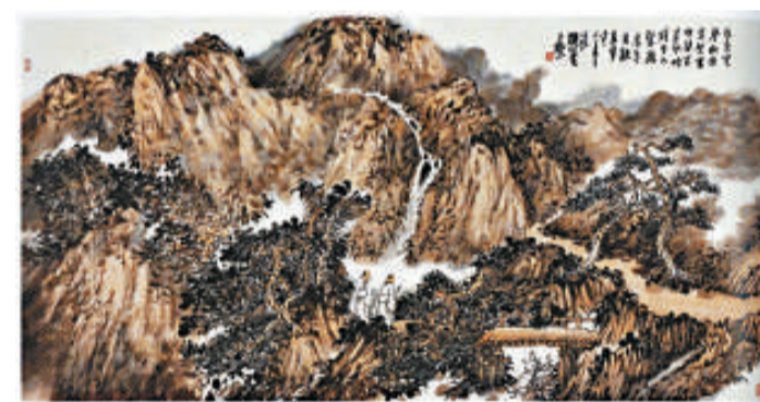
陸壯的山水畫作品