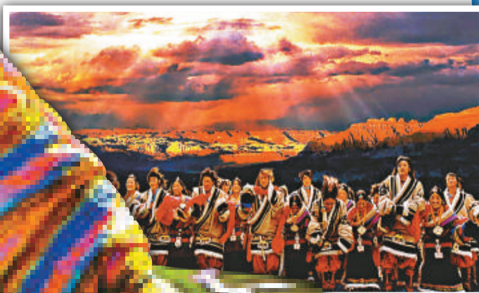
不少參演的演員都是牧民