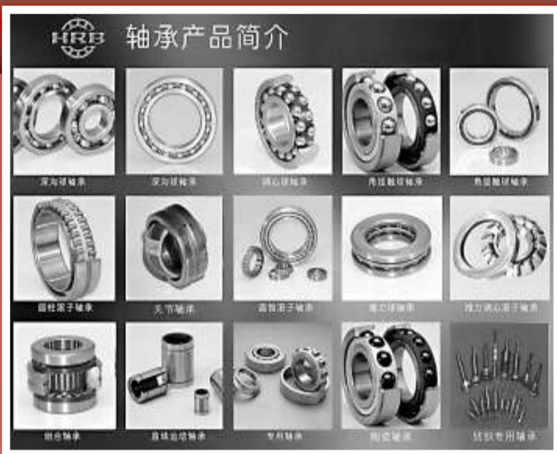
▲ HRB牌軸承榮膺2008至2009年黑龍江省出口名牌

集團公司的發展目標是將富拉爾基建成國際名列前茅的大型鑄鍛鋼基地;將大連棉花島建成加氫、核電、大型成套產品的組裝發運基地;將天津研發中心建成國家一流的重型裝備研究基地。(本報記者 傅彥華)