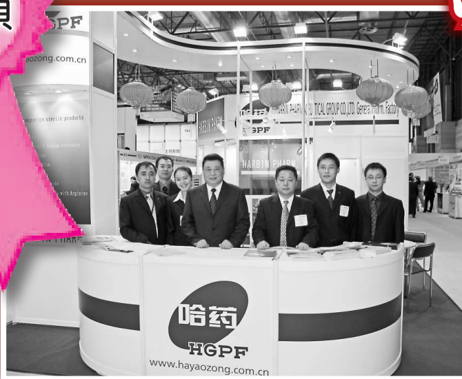
▶ 「哈藥」人放眼世界,將「哈藥」打造為世界知名名牌作為下一個目標