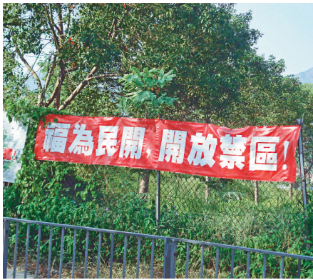
沙頭角區內布滿要求開放的標語

新和高大的建築物全在深圳的沙頭角內，兩個沙頭角的對比何等強烈！為何港境沙頭角的發展一直停滯不前呢？看看滿布區內各個角落的布條標語便明白了：「禁區紙，遊客止！」、「福為民開，開放禁區！」、「開放是沙頭角的出路！」、「強烈要求政府於2010年開放整個沙頭角城，並撤銷海禁，還我們自由、人權及營商環境！」禁區應否撤銷一直爭論不休。