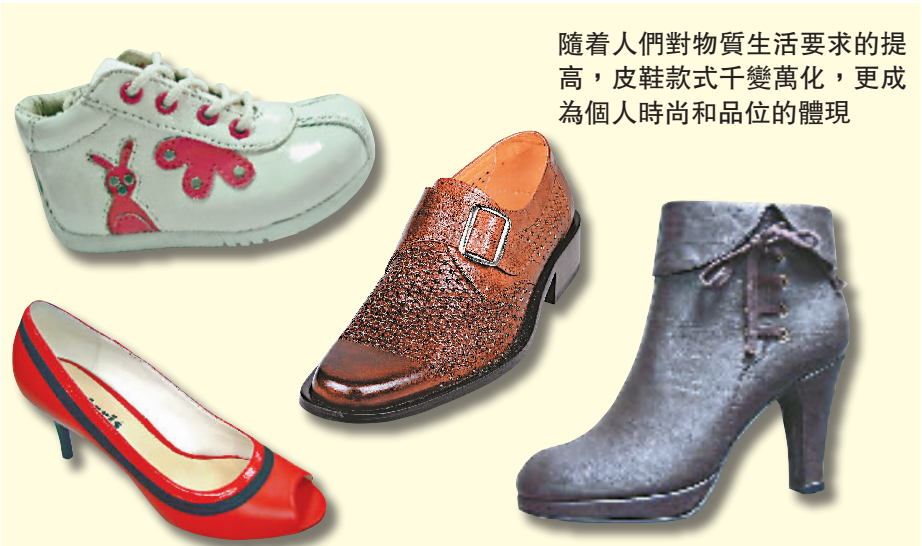
隨着人們對物質生活要求的提高，皮鞋款式千變萬化，更成為個人時尚和品位的體現

幾千年前，人類的祖先就已有穿鞋的習慣，用獸皮裹足、用皮造履到現代皮鞋，人們穿着皮鞋的歷史相當悠久。