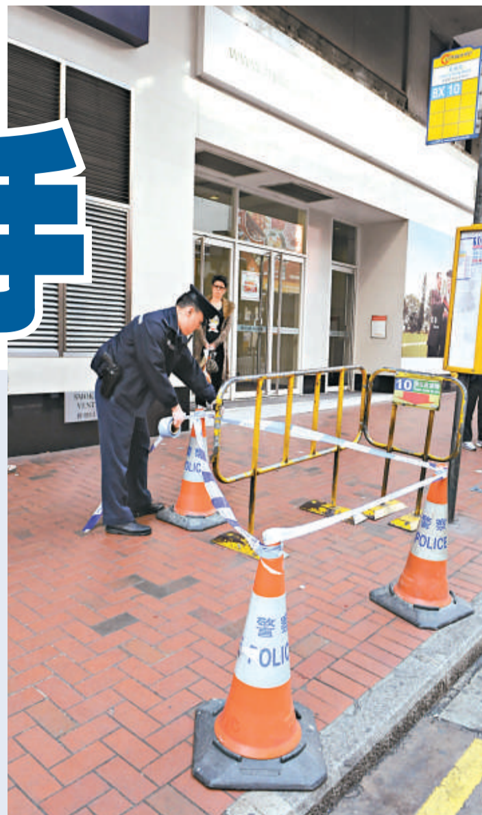
◀廣告公司法籍經理被撲頭