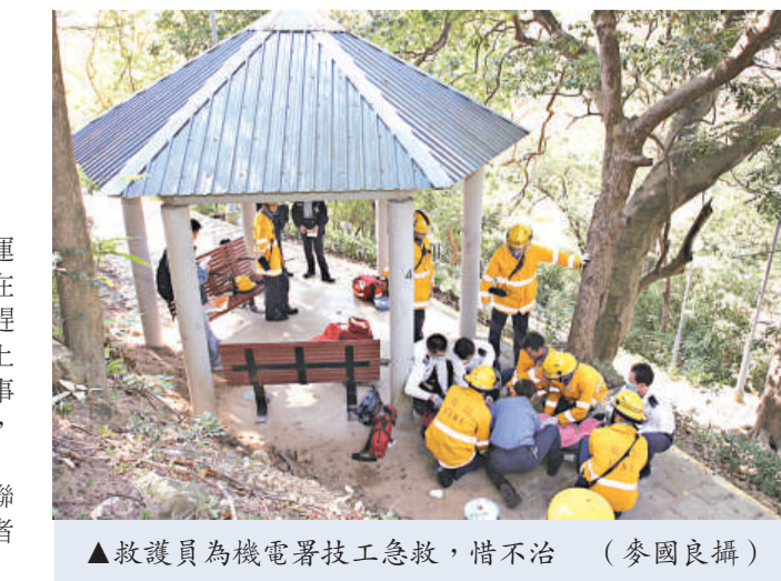
▲救護員為機電署技工急救，惜不治

警員經初步調查，認為事件無可疑，已聯絡其胞姊了解情況，現場沒有發現遺書，死者自殺原因有待調查。