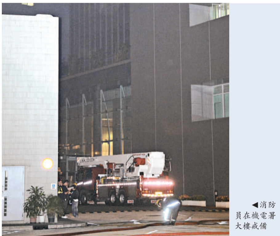
◀消防員在機電署大樓戒備

生命危險。但另一個嚴重問題是後遺症，受創後問題不是即時浮現，或會潛伏一段時間，腦部永久受損，出現手腳不受控制、記憶力永久退化、言語障礙、身體機能出現異常，受害人不能永久康復。撲頭劫案在十年前令人聞之變色，受害者多為地盤工人，不少人因此喪命，警方不排除是黑工所為，曾在地盤展開監視戰，情況一度改善。