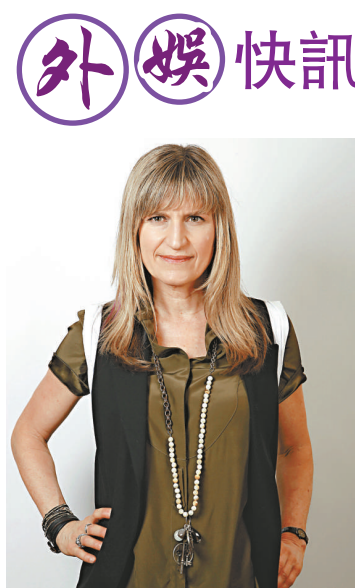
▲嘉芙蓮無緣拍《吸血新世紀》續集