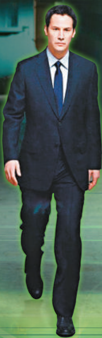
新版《地球停轉日》以環保為課題