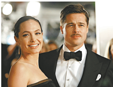
▲畢彼特（右）與安祖蓮娜恩愛行紅地毯

畢彼特（Brad Pitt）與女友安祖蓮娜祖莉（Angelina Jolie）本周一恩愛現身畢彼特新片《奇幻逆緣》（The Curious Case of Benjamin Button）在加州舉行的首映，旋即成為鎂光燈的焦點。這一對已經擁有六名孩子的圈中愛侶，從不諱言會繼續壯大家庭成員的數目。安祖蓮娜日前接受雜誌訪問時暗示，她與畢彼特或會為了領養更多孩子，踏入婚姻殿堂；她說：「阿畢與我沒有結婚。在很多國家，一名單身女人或單身男人在技術層面來說，都很難被批准領養。」