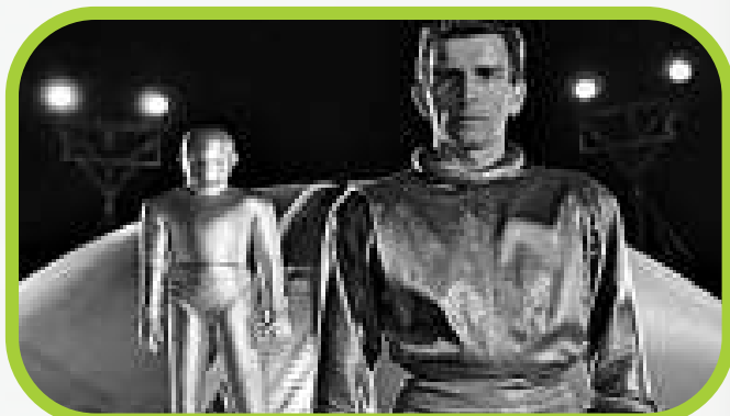
原版在上世紀五十年代而言，表達手法可算前衛