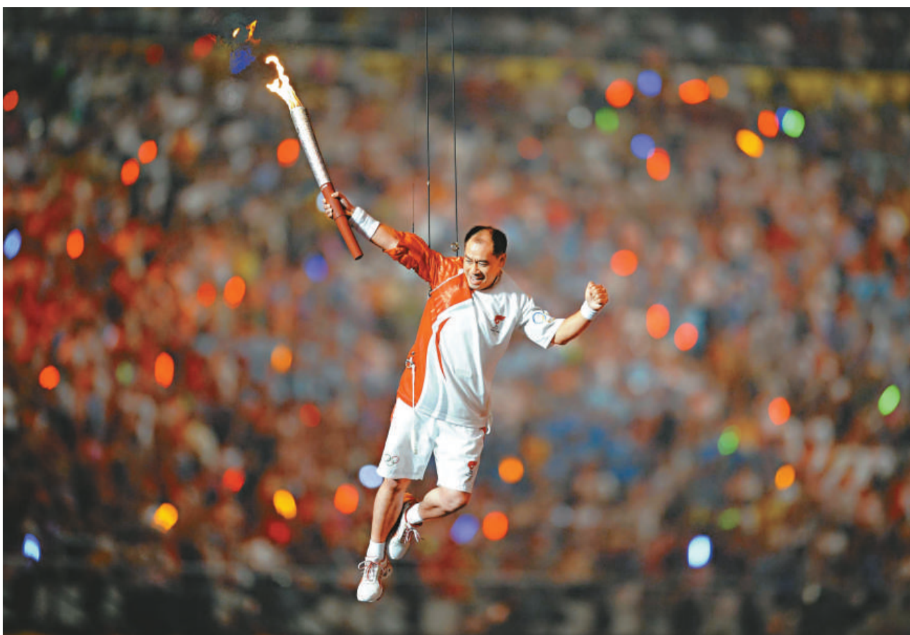
李寧點燃聖火為京奧留下了經典一幕，而包括張藝謀在內等五個和奧運有關的人物入選本年度中國人物，顯示了京奧的成功對中國巨大的影響（資料圖片）

據悉，反扒聯盟是註冊的民間公益團體，業務上受洛陽市巡警指導，但抓賊完全是義務勞動，沒有任何報酬。而且今年來抓了五六十個小偷，幫助破了不少案。對此，網友表示，既然反扒聯盟是被政府機構承認的組織，應該考慮給予一些照顧。另一方面，亦有網友認為任何人都無權代替公權執法，不贊同民間執法。有律師亦擔心，反扒隊員在義務工作時有可能侵犯公民的合法權益。