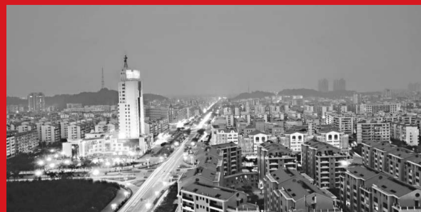
▲隨着高明經濟社會跨越式發展和城市化的不斷推進,城市面貌日新月異。圖為高明中心城區

在過去30年的歷程中,高明在成就自己的同時,也沉澱了許多寶貴的改革經驗: 一是要堅持打造大交通,建立完善的交通網絡,拉近高明到廣佛都市圈的時空距離。 二是要堅持打造大園區,大力發展統一、集約的園區經濟,促進產業集聚發展。 三是要堅持打造大產業,狠抓招商引資和大項目引入,做大做強支柱產業。 四是要堅持打造大城市,以規劃發展引導城市發展,積極融入廣佛經濟都市圈。 五是堅持打造大環境,抓好污染控制和環境保護,以良好生態環境促進經濟社會發展。