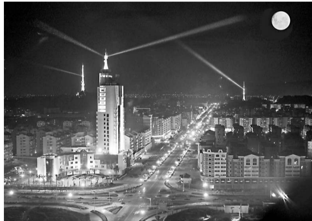
▲荷城夜景 ▼一橋變三橋之前世今生 (洗浩均 攝)

發展的最終目的是為了增進百姓的福祉,高明將利用好國家擴大內需的機遇,加快各項民生事業發展步伐。一是加快首批廉租(公)房的建設步伐,並繼續加大投入建設經濟適用房和其他廉租(公)房,切實解決困難群眾和特困難家庭的住房問題。二是加快基層衛生院改造,爭取在明年內完成四個基層衛生院和一個社區衛生服務中心建設。三是加快二次水改進度,爭取明年能完成大部分自然村的「飲水難」問題。四是繼續加大對社會保障體系建設的支持力度,加快改革全區地農民養老保險,不斷提高社會救濟和醫療救助的水平。五是加快教育資源整合,爭取明年全面實現教育現代化。高度重視衛生醫療事業發展,切實提高人民生活水平。