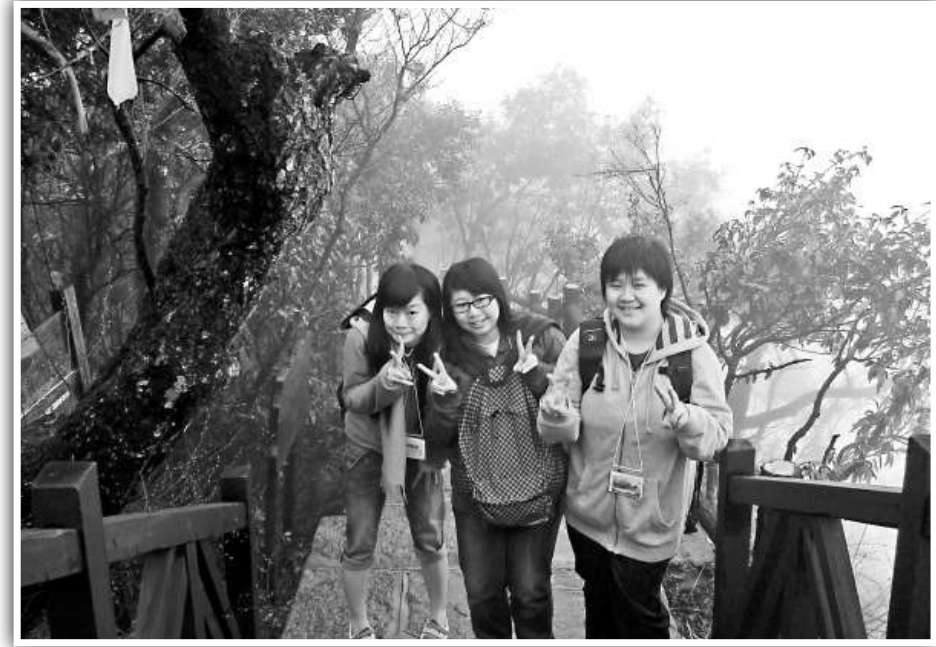
▲煙雨迷濛的天氣，無損同學結伴欣賞張家界美景的興緻

最後我們來到金鞭溪進行全長五公里的徒步拉練。當時，天下着毛毛细雨，但金鞭溪的景致在雨粉的洗滌下更顯秀麗。我們有些同學早着先機，因為怕弄濕鞋子而一早配備了防雨鞋套，可惜的是只走了幾步鞋底便穿洞了。由於小徑較窄，加上那天遊人特別多，有的轎夫更是以極速抬着轎子快步前進，幾乎把我們撞倒。 當晚上我們下榻金都大酒店後，大家都在疲倦中迅速進入了夢鄉。 第五天的行程，我們前往集合佛道儒三家建築藝術於一體的普光禪寺參觀。普光禪寺建於明朝，由皇帝賜建，集宋、元、明、清各個朝代的建築風格，具有很高的歷史價值與觀賞價值。同學們發現，寺中的斗拱規模比其他同類型的寺廟都宏偉，原因在於普光禪寺是皇室建築，因此規模較大。另外，寺中有很多地方都凸現了皇室的地位，如大雄寶殿外的柱子上有龍標記等。 第二個行程是參觀張家界資源化工有限公司。這個化工企業採用現代生物化學技術對五倍子進行深入加工，提取化學成分，進而廣泛運用於食品、醫藥、航空等多個領域。可惜當時適逢搬遷期間，我們只看到仍未開始運行的新址，不過同學們的求問興致不減，積極向負責人發問。 不少人都認為中國的環保工作仍然落後，不過資源化工的負責人表示，國家對企業的環保工程要求嚴謹，不容許過分污染的情況出現。由此可見，在政策上國家對環保是很着緊的。 我們隨後來到張家界市第一中學進行學