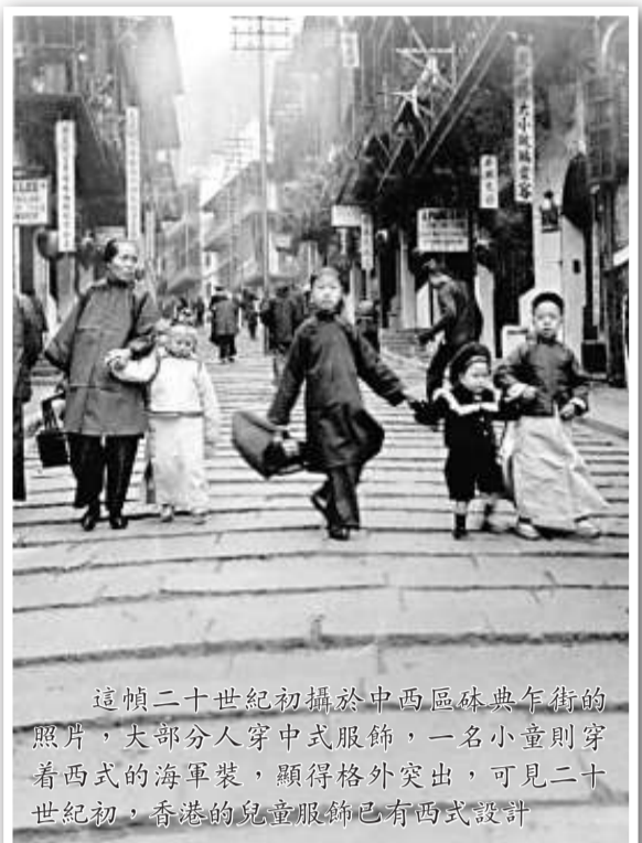
這幀二十世紀初攝於中西區休典年街的照片，大部分人穿中式服飾，一名小童則穿着西式的海軍裝，顯得格外突出，可見二十世紀初，香港的兒童服飾已有西式設計

深圳圖書館則選取了改革開放三十年間的一些市容照片，讓人回溯這個現代城市的打造過程。是次「歲月的回憶」聯展，即日起至十二月十六日在香港中央圖書館展覽館舉行，其後移師其他香港公共圖書館分館巡展。此外，三地圖書館亦於同期舉行是項展覽，十二月二日至三十一日在深圳圖書館、十二月九日至明年一月八日在澳門中央圖書館，以及十二月二十三日至明年一月二十三日在廣東省立中山圖書館舉行。