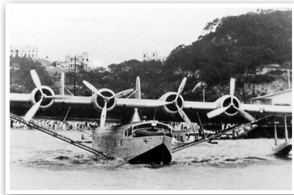
澳門上世紀五十年代的水上飛機

在住方面，可見到一八八一年上環東來街的牌樓，「牌樓」跟牌坊相近，是中國傳統建築的類型；以及一八九〇年的唐樓照片，唐樓英文名稱為Shophouse，因為地下通常有舖舖。