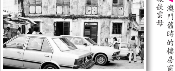
澳門舊時的樓房窗戶會鑲嵌雲母