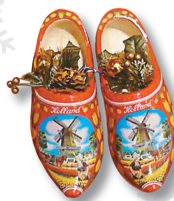
繪有風車的木屐成為荷蘭旅遊必買的紀念品