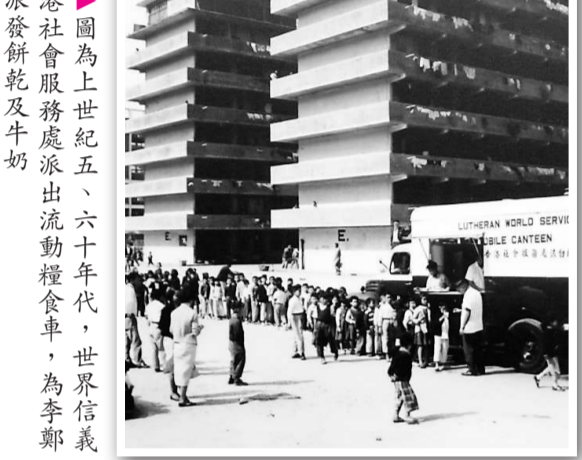
圖為上世紀五、六十年代，世界信義宗香港社會服務處派出流動糧食車，為李鄭屋邨派發餅乾及牛奶