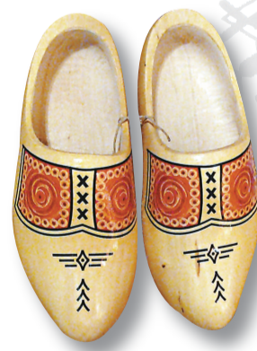
這對木屐上所刻的是荷蘭傳統的紋飾（本報攝）