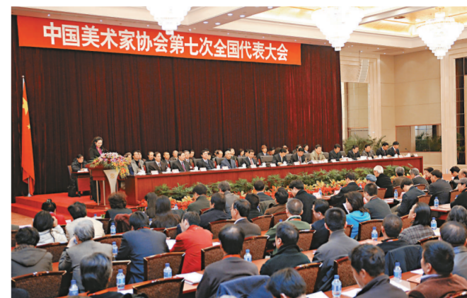
中國美術家協會第七次全國代表大會在北京召開

而對於台灣藝術家，章程新增加的條款中規定：「為中國美術事業的發展做出特殊貢獻的台灣同胞和海外僑胞中的美術家，經主席團審批，可授予名譽顧問、名譽理事、名譽會員。」這意味著，雖然台灣畫家在一段時期內無法成為美協會員，但有機會成為名譽顧問、名譽理事和名譽會員，這將有助於兩岸四地藝術家的進一步交流，弘揚中華民族文化。