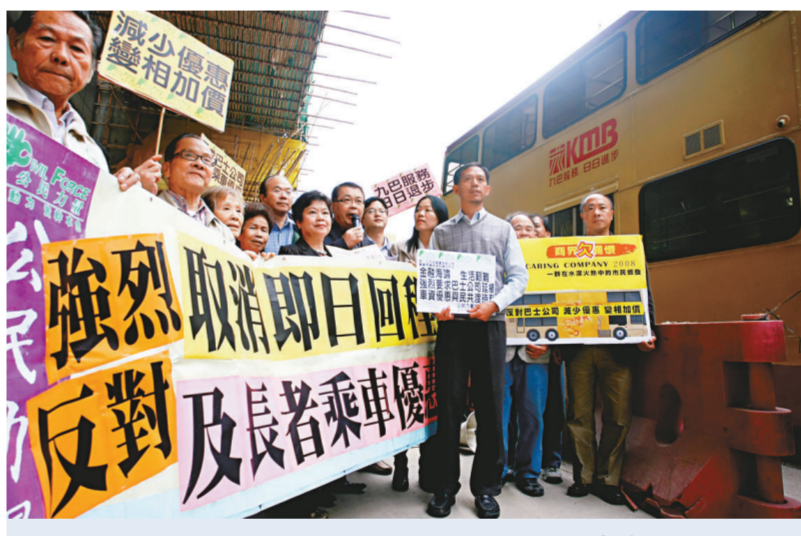
團體到九巴總部抗議，不滿取消長者及回程車費優惠

【本報訊】金融海嘯下各公共機構帶頭降價，與市民共渡時艱。四大巴士公司卻在此時宣布取消乘車優惠，遭到多個政黨和團體強烈反對，他們約五十名代表昨日先後到九巴總部請願。有政黨批評九巴變相加價，加重市民生活負擔，並忽視長者需要，缺乏企業良心。另有請願長者表示，九巴取消假日優惠，令他們被迫減少外出，恐令隱蔽長者問題惡化。