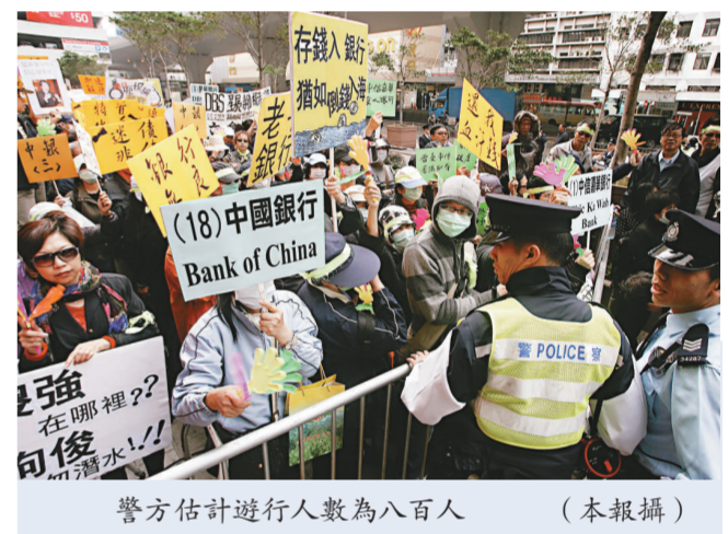
警方估計遊行人數為八百人

根據遺書內容，女事主花六十四萬美元購入雷曼債券，並獲得現金回贈約一萬三千元。自雷曼出事後她「好痛苦」，終日躲在家中；並提到「訴訟是漫長的路，遙遙無期，而且花費龐大」，感到焦慮和恐懼，遺書內容一字一淚。