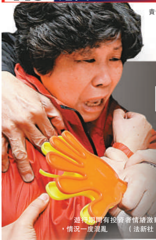
遊行期間有投資者情緒激動，情況一度混亂