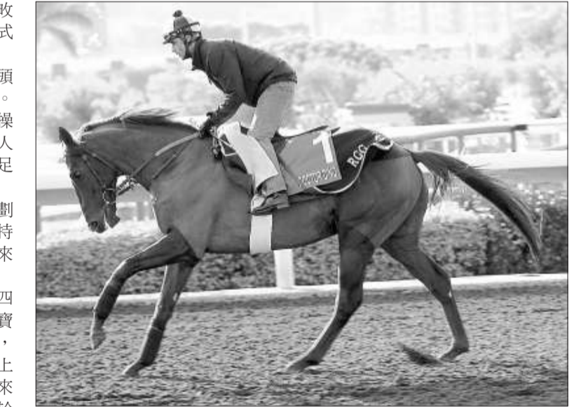
「迪諾醫生」長途實力強橫，有力取勝

第五場，香港短途錦標千二賽事。「安歌」上仗在千二米預賽中贏得頭馬，今次跑正式錦標大賽，可再爭頭馬錦標。 「阿帕奇貓」在澳洲連番跑一級賽事贏頭馬，此程成績交得準，是至強之外來挑戰者。「陽光」上仗在同程僅負於「安歌」，復課操練保持活躍好水準，還具爭份子。「黃金商人」在法國一級賽事連番贏頭馬，水準穩定，足以推翻一切。冷腳取「綠色駿威」。 第六場，第三班馬跑四千米。「應變計劃」上仗在千四米贏頭馬，表現正勇，操課維持上佳勇態，在三班作戰仍具信心，力足以再來贏頭馬。 「驃驍王」近三仗取得一冠兩亞，在千四米上作戰選具信心，主力威脅份子。「真奇寶」轉入薛達志馬房，兩次跑四千米都入位置，當然意猶未盡，還具爭份子。「中國陸家」上季尾贏兩仗六米，復課走勢趨好，由韋達來騎，依然具份量之爭份子。冷腳取「業成於思」。