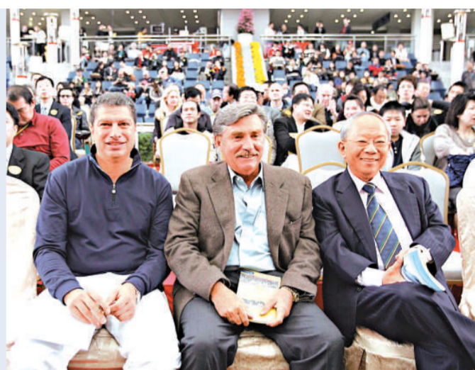
▲右起：香港賽馬會主席陳祖澤、副主席施文信及賽馬事務執行總監利達賢，出席2008年香港國際馬匹拍賣會