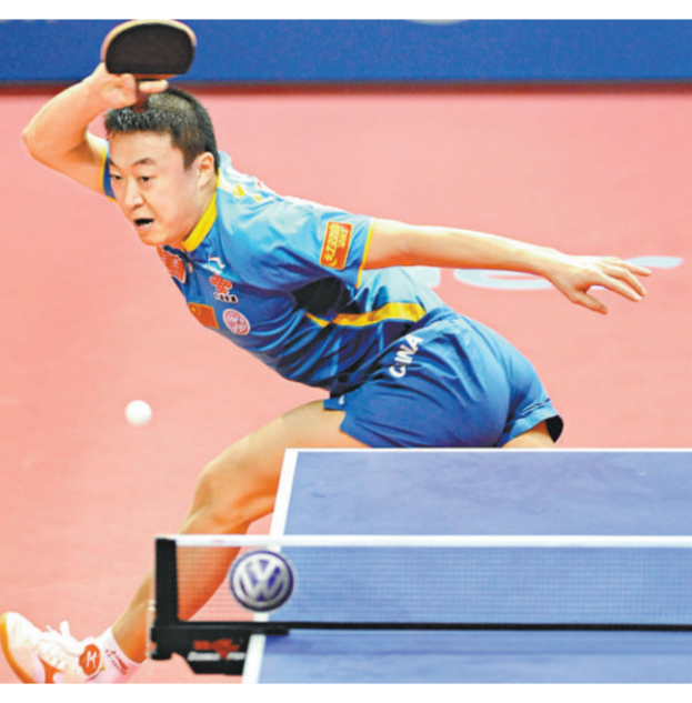
▲馬琳躋身國際乒聯職業巡迴賽總決賽男單準決賽

對於28歲的馬琳來說，高強度的訓練和長期的征戰，讓他的身體狀況並不是非常理想。他表示，在之前做的檢查中，肘部的傷比想像的要嚴重一些。他現在正與教練和隊醫一起努力，讓傷勢不惡化，以延長自己的運動壽命。馬琳說：「在去年的奧運會上奪得了冠軍，實現了自己的目標，可以說是捅破了那層窗戶紙。我現在的心態更加積極一些，在對自己心態的調整上也會更加有利。」