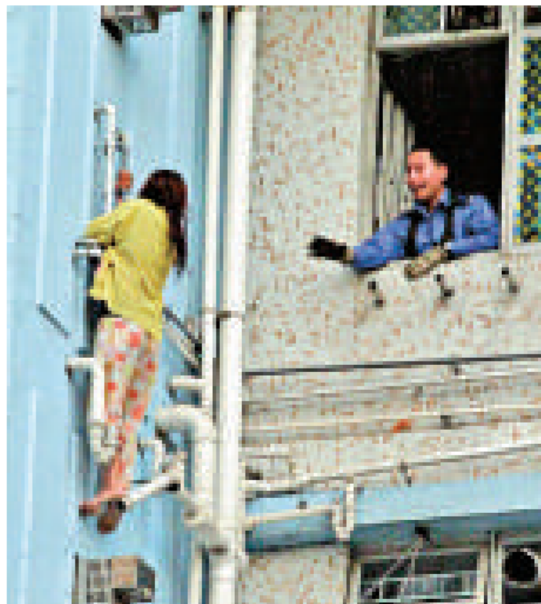
▲踩斷喉管的女事主險飛墮而下

【本報訊】旺角海富苑一名少女昨日與家人爭執後情緒激動，爬出寓所窗外，赤腳危坐熱水爐出風口企圖自殺，其後心情平伏願意入屋時卻踩斷喉管，險飛墮而下送命，幸由消防員相扶平安脫險。其母因目睹經過「嚇死」，兩母女需一同送院檢查。