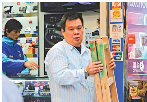
▲經營影音店的蘇先生，希望事件不會嚇走顧客 (本報攝)