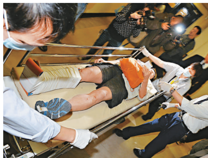
▲其中一名男子右腳受創被送院

該籌款活動由一群熱愛行山遠足者發起，早於二〇〇〇年初便展開，其宗旨強調是推廣環保旅行遠足康體活動，並藉此籌集善款，作為支助內地偏遠貧困山區失學或在學兒童學習費用。其原則則是要以身體力行，去體驗山區學童要走長路上學的艱辛。