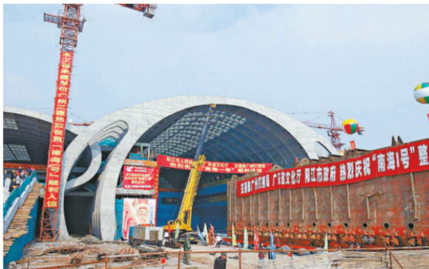
「南海一號」目前仍安放於「水晶宮」，圖

「南海一號」是中國目前發現年代最早、船體最大、保存最完整的古代遠洋貿易商船，承載着巨大的文物信息。在二〇〇七年十二月二十八日成功入駐廣東海上絲綢之路博物館「水晶宮」後，一直封存在巨大的沉井中，古船何日見真容一直備受各界關注。