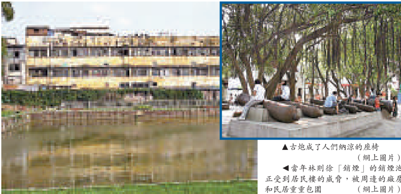
▲古炮成了人們納涼的座椅

據介紹，虎門炮台舊址二期維修工程設計有望在明年三月份前完成，全部維修工程則預計在2010年前後完成。