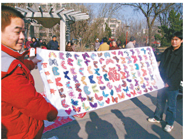
一位「換客」自製的「百蝶起舞」

專家介紹，現在大家都住在高樓大廈內，平時鄰里之間缺乏溝通和交流，換物節這樣的形式不僅可以使大家互通有無，把自己的閒物變成別人的寶貝，倡導了節儉環保的理念，也給社區居民提供了一個相互交流和溝通的平台，既收穫了對自己有用的「寶貝」，也收穫了鄰里間融洽的情感，這無疑推動了和諧社會的建設。