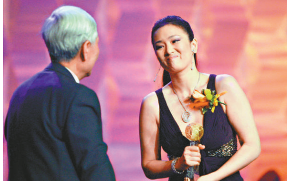
中國全國政協委員、著名影星鞏俐，近日宣誓成為新加坡公民，引起一片爭議。圖為鞏俐獲頒「2007影響世界華人大獎」