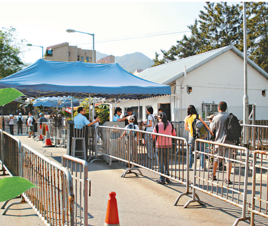
在沙頭角禁區，兩地居民通過關卡進進出出