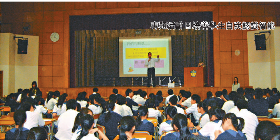
專題活動 培養學生自我認識智能