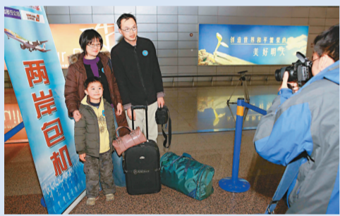
▲旅客在上海辦理登記手續前合影留念

台灣中華航空公司的這架CI7989航班搭載了十三位機組人員和二百八十九名旅客，於上午十時十分準時降落在杭州蕭山國際機場。蕭山國際機場準備了兩輛消防噴射水柱，在空中交匯成巨大的水拱門，為來自台灣的同胞接風洗塵。令人驚喜的是，在當時陽光的照射下，漫天水霧中出現了一道美麗的彩虹，仿若在隱喻直航為兩岸同胞構築起親情與友誼之橋。在此之前，中國廈門航空公司的MF885航班，於九時五十分起飛前往台灣松山機場，完成了杭州至台灣的直航首飛之旅。