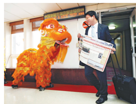
▲深圳航空抵台搶得頭香，舞獅恭迎

【本報記者唐剛強深圳十五日電】今晨七時二十分，深航一架波音長洲號客機載着一百二十多名旅客由深圳寶安機場起飛，僅歷時八十一分鐘，穩穩地降落在台北松山機場，在大陸二十一個包機直航航點中拔得頭籌，成為執飛兩岸常態包機的首個航班。