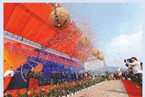
▲海峽兩岸海上直航福州港首航儀式舉行