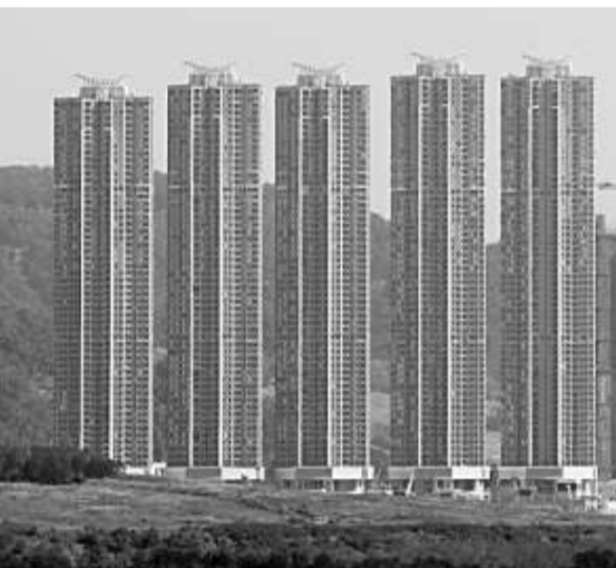
臨近上會的首都，備受海嘯拖累錄得蝕讓個案

一場金融海嘯令樓價插水大跌，業主錯過放盤良機，投資者見財化水之餘，更慘至要「輸凸」，今年旺市三月開賣第一「Q」清袋的日出康城，錄得蝕近百萬元成交，業主已支付約100萬元的首期化為烏有。