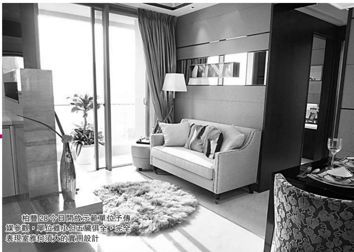
柏豐28今日開放示範單位予傳媒參觀，單位雖小但五臟俱全，完全表現室雅何須大的實用設計

資董事黃思聰表示，旗下渣甸山名門尚餘的4伙壓軸特色戶，先推出第3座頂層山景複式住宅「Emerald of The Legend」接受買家競價，單位位於3座頂層57至58樓C室2477呎，受價4500萬元包500萬元裝修費用，起步呎價逾1.82萬元，以現時市況計算，估計單位市價呎價逾2萬元，本月三十一日截止競投。