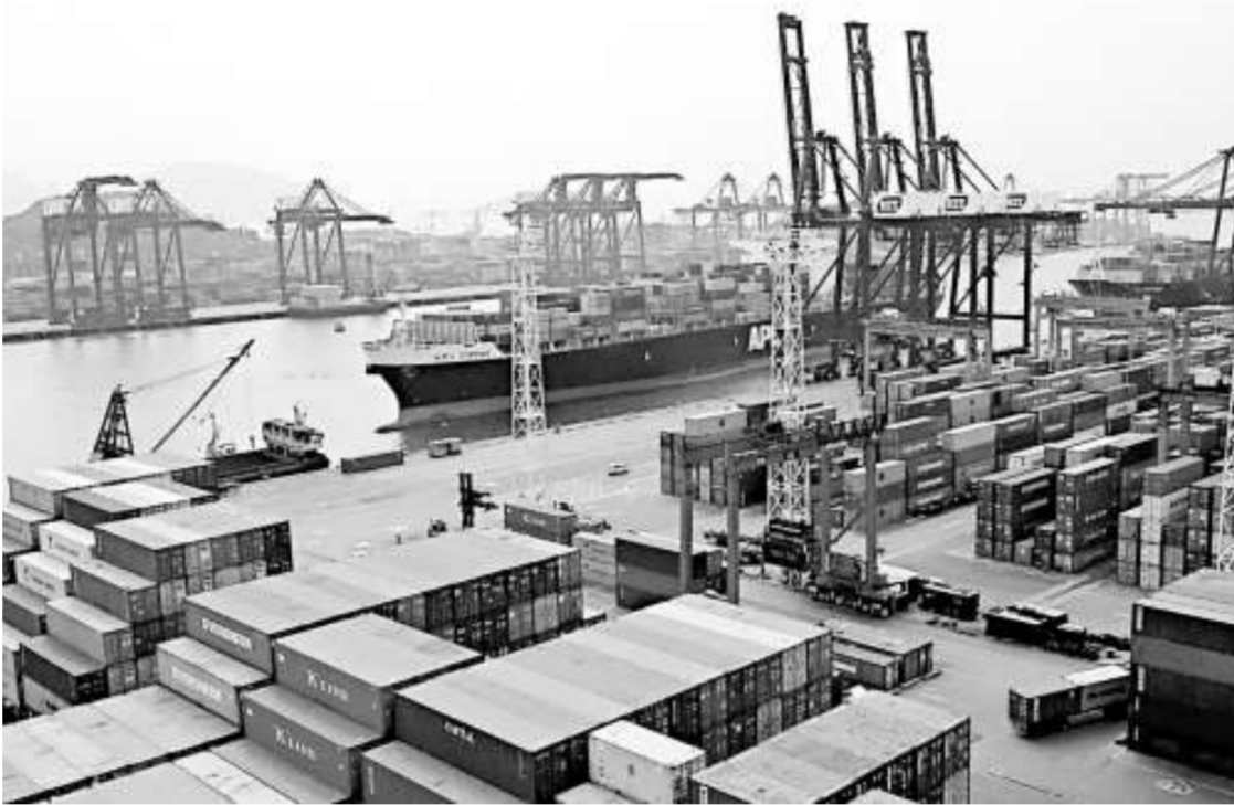
香港貨櫃碼頭一直扮演的轉運角色，在經濟轉差之下，抵抗下跌能力很脆弱

港發局的最新數字顯示，兩大區域的運輸作業均錄得月吞吐量下跌。內河、中流作業和公眾卸貨區貨量是46萬箱，同比狂跌31.1%，跌幅達三成以上，顯見來自珠三角內河運的貨量大減。而葵青港區錄得134.5萬箱，是今年以來單月首次下跌，跌幅在4.7%。