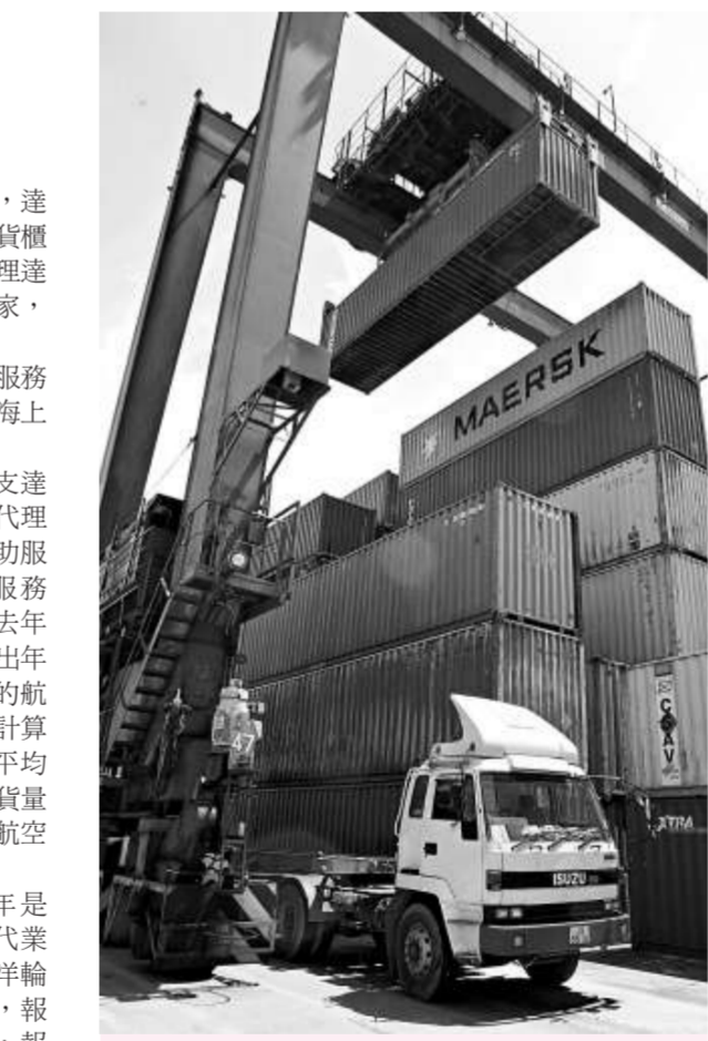
物流行業僱用工人逾萬人，有4個服務工種

新加坡航空公司11月客運量下跌至154萬人次，同比下跌6.1%，是自2003年8月以來錄得的最大跌幅。該公司9月客運量已經下跌，3年來首次錄得下跌，主要受商務需求和旅遊意欲同時下跌影響。國際航空運輸協會(IATA)較早前亦預期，明年全球客運量會下跌3%，將會是自2001年以來首次出現下跌。