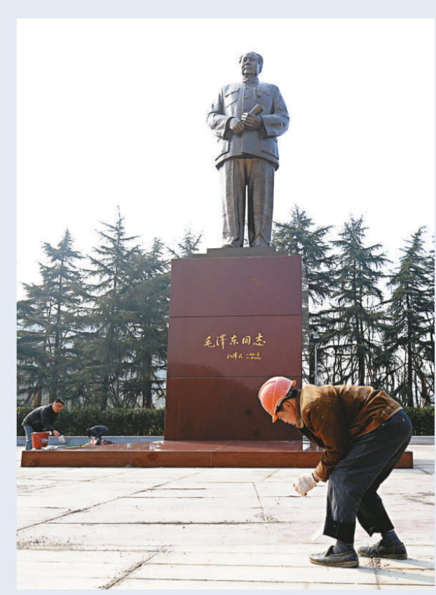
湖南省湘潭市韶山沖毛澤東銅像移位及廣場改建工程將於12月25日全面竣工...