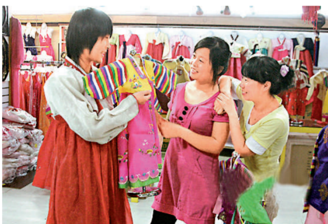
韓國服裝隨着韓劇進入中國，是「韓流」風行可觀可聽的「證據」。

生意不好做了，不少韓國人選擇回國，以前作為青島中高檔社區租務主力的韓國租房客大幅減少。