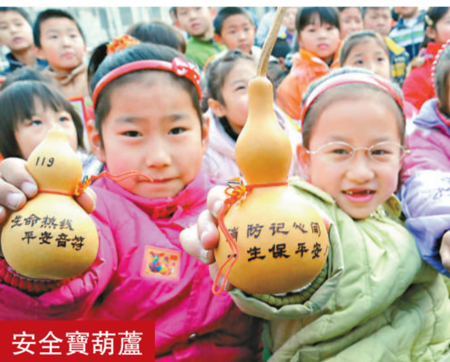
河南鄭州中原消防大隊為小學生宣傳普及消防知識，帶來了許多繪有消防知識的葫蘆。

據湖南省有關方面透露，紀念活動包括紀念座談會、毛澤東廣場落成典禮、毛澤東遺物館開館典禮、文藝演出。