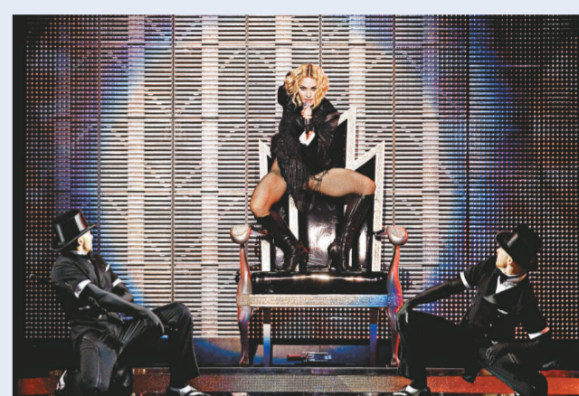
▲麥當娜現正舉行世界巡迴演唱會，下一站為巴西里約熱內盧

影星辛潘，兩人於一九八五年結婚，四年之後離婚收場。麥當娜目前正進行世界巡迴演唱。她將於二十二日在巴西的里約熱內盧表演。