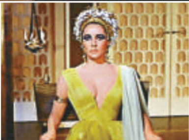
▲專家以電腦特技拼出埃及妖后的原貌