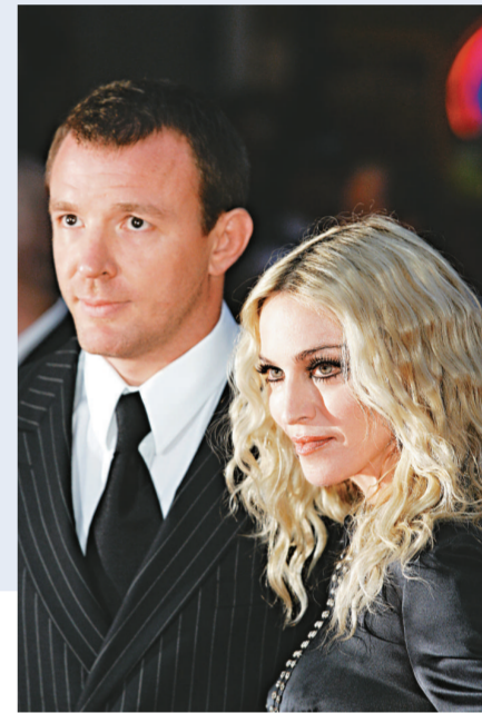
◀今年九月一日，麥當娜（右）與丈夫曾一同出席電影的首映禮（資料圖片）