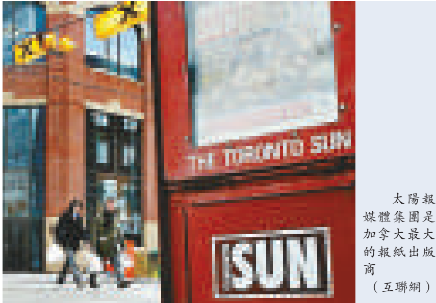
太陽報媒體集團是加拿大最大的報紙出版商（互聯網）

加媒體大量裁員導致業界普遍性的擔心。傳媒、能源和報業工人工會表示，雖然面對經濟危機，但社會更需要穩固、多元的報道和觀點。而隨著人員減少，信息量也會跟著驟減。