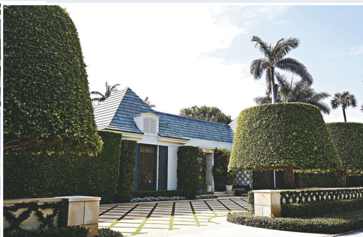
▲馬多夫在佛羅里達購置的豪宅

法國前歐洲事務部部長茹韋剛在本周接任法國金融市場監管局（AMF）主席。他說：「這是美國監管機構第四次出現問題。」他指美國金融界過往已發生過三次危機：一九九八年美國長期資本管理公司（LTCM）倒閉事件、〇一年安然能源公司（Enron）涉及的偽造賬目醜聞和今年九月的雷曼兄弟破產。