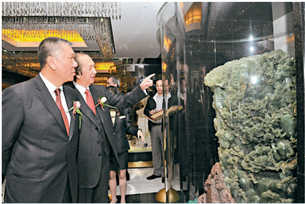
▲澳博行政總裁何鴻燊陪同澳門行政長官何厚鏞參觀「錦繡中華·盛世北京」展覽中的玉石雕刻展品