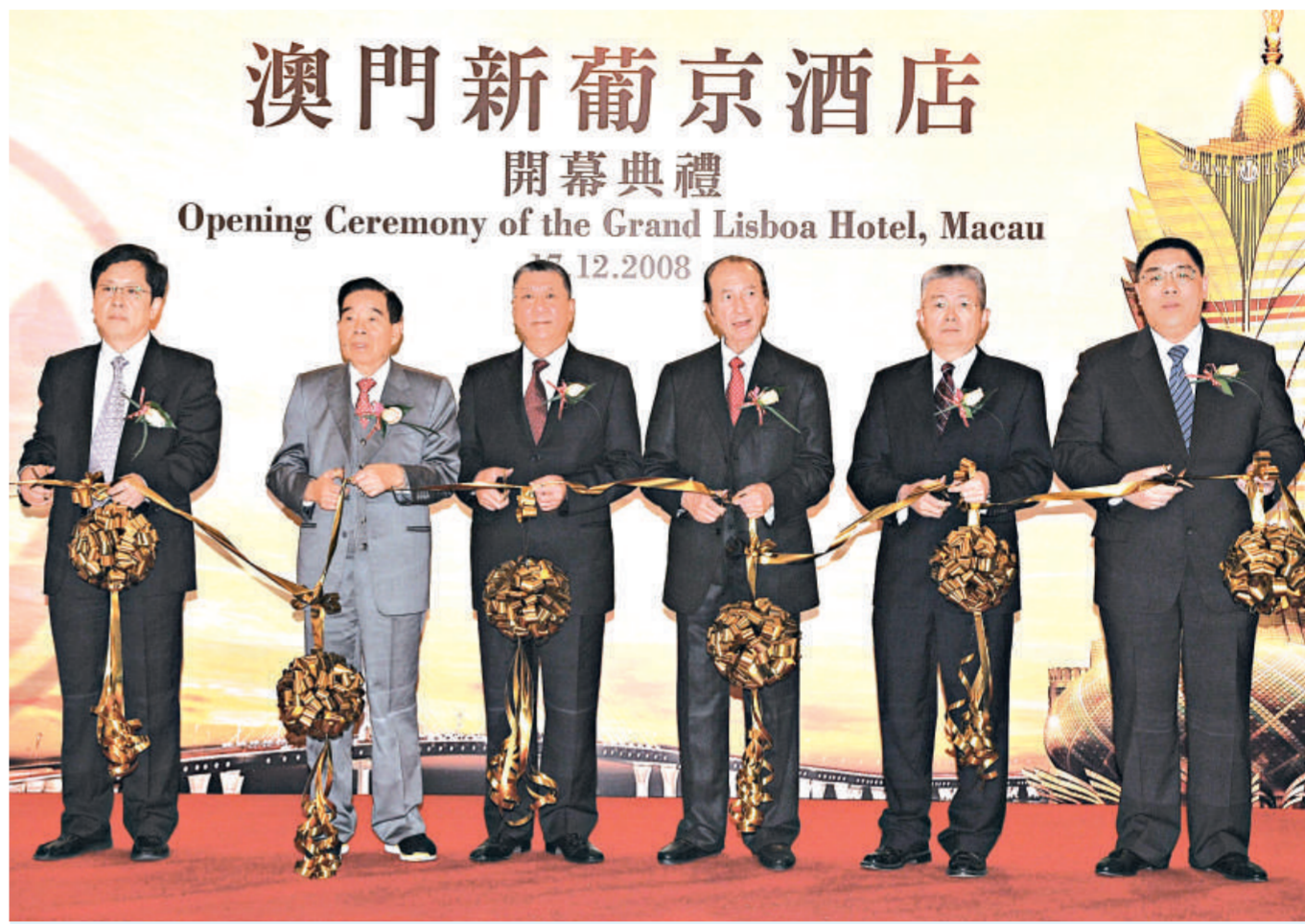
▲澳門行政長官何厚鏞（左三）、中央駐澳門聯絡辦副主任徐澤（右二）、外交部駐澳門特派員宋彥斌（左一）、澳門文化司司長崔世安（右一）、澳博行政總裁何鴻燊（右三）與澳博董事局主席鄭裕彤（左二）主持新葡京酒店開幕剪綵儀式

鑒於內地個人遊收緊政策的實施，以及全球經濟正受金融海嘯影響，對澳門博彩業發展的影響，蘇樹輝表示，就旅遊數字來看，旅客入境數字受各種因素影響，由於數月來數字反覆不定，並不能完全體現政策對澳門業界的影響。不過，以博彩收入來看，今年1至10月澳門整體收入已有930億，已超越去年全年的博彩收入。至於有博企因財困出現「瘦身」和裁員現象，蘇樹輝認為，是由於某些企業過度借貸及投資所致。金融海嘯突如其來，打破良好的市場預期，令某些企業因市場欠佳而面對危機，但澳博則沒有出現這個情況，新葡京酒店造價70億，沒有超出投資力度。面對金融海嘯衝擊，澳博同樣會設法節省成本，增加收入，但並不考慮裁員。