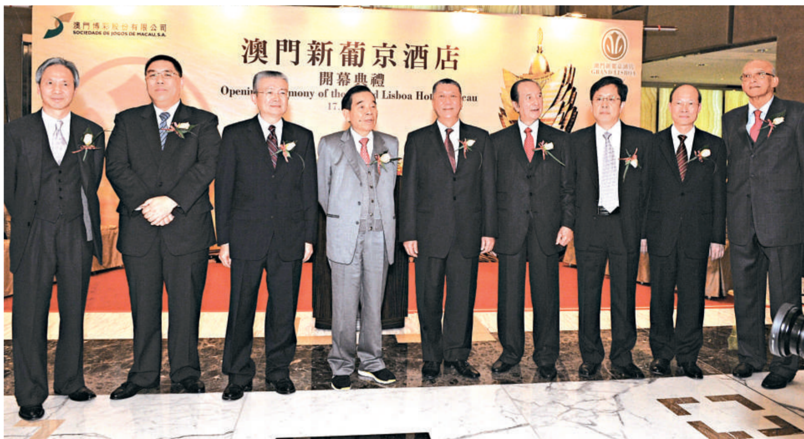
▲由左至右：澳博董事兼營運總裁吳志誠、澳門文化司司長崔世安、中央駐澳門聯絡辦副主任徐澤、澳博董事局主席鄭裕彤、澳門行政長官何厚鏞、澳博行政總裁何鴻燊、外交部駐澳門特派員宋彥斌、澳博董事蘇樹輝及官樂怡大律師於新葡京酒店開幕儀式上合照