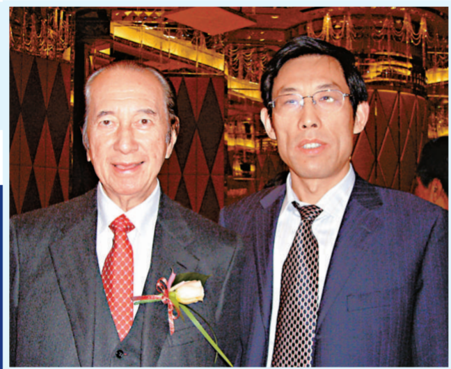
▶本報常務副社長姜在忠與澳博行政總裁何鴻燊（左）合照