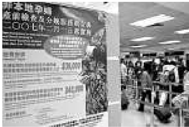
內地婦來港分娩收取費用覆核被駁回

醫管局自去年二月起，將非本地孕婦在公立醫院分娩的費用，由二萬元增加至三點九萬元，如沒有預約，費用則為