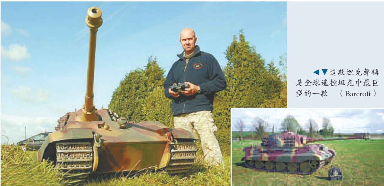
▲▼這架坦克聲稱 是全球遙控坦克中最巨型的一款

其他有售的坦克型號包括著名的美國「雪曼」坦克、德國「老虎一」型和俄羅斯的「T34」坦克。