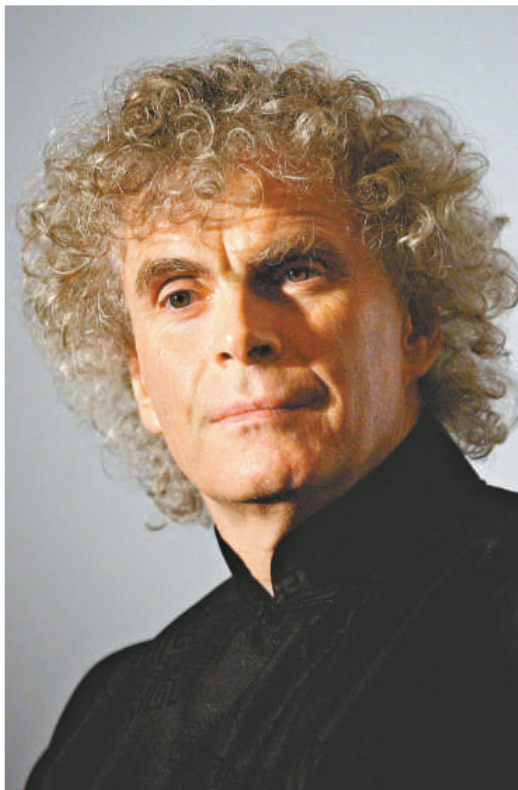
▲▼柏林愛樂樂團首席指揮拉圖 （互聯網）