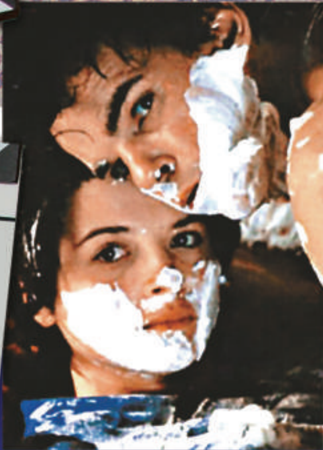
▲《虎父無犬子》為卡拉斯的名作

上世紀八十年代中旬，法國影壇出了三位年輕新貴，《巴黎野玫瑰》(Betty Blue)的尚積葵貝力(Jean-Jacques Beineix)、憑《花都夜深沉》(Subway)及《夜海傾情》(The Big Blue)成名的洛比桑(Luc Besson)，以及《虎父無犬子》(Mauvais Sang)的里奧卡拉斯(Leos Carax)。三人合力打造了一個「風格重於內容」的Cinema du look風格。