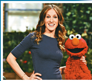
▲柏加參演《芝麻街》，興奮莫名