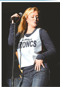
▲Mindy自殺，幸未釀成慘劇