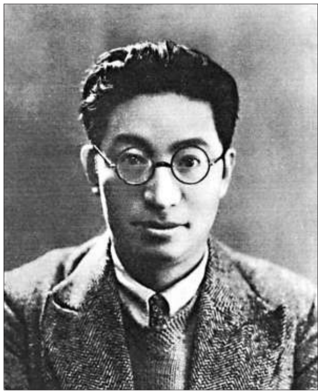
鄭振鐸（一八九八——一九五八）