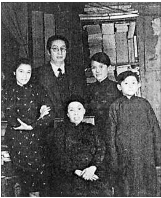
鄭振鐸五十歲生日時與家人合影。左起：女兒鄭小箴，二：鄭振鐸，三：夫人高君箴，四：兒子鄭爾康，中坐者：鄭田郭氏

在一九三〇年代反對國民黨「文化圍剿」的鬥爭中，鄭振鐸在左翼文化界內部發揮了重要的團結作用。例如，據茅盾回憶，一九三四年一月，鄭振鐸等人主編的在上海出版的進步刊物《文學》，面對遭到國民黨當局嚴查亂收的嚴峻形勢，茅盾發出急信，請當時在北平的鄭振鐸南下研究對策，同時還對他說：「還有一件事專等回上海來辦。自從『休士事件』（陳按：指傅東華在《文學》上發表了攻擊魯迅的文章）之後，魯迅對傅東華大有意見，對《文學》也取不合作態度，已有半年不給《文學》寫稿了。對這次刊物上署東華的名字，他也不滿意。我的話，他只聽一半。所以要請你去個『說客』，消除一下誤會。」他就與茅盾一同去魯迅