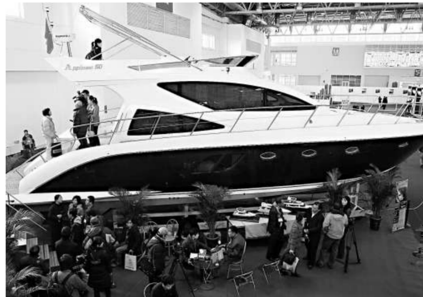
在早前某遊艇展上吸引部分買家前來洽購(資料圖片)

目前，珠海有各種遊艇製造企業二十三家，二〇〇八年珠海遊艇產值超十億元，並且每年以百分之五十以上的速度增長。據專家預測，珠三角地區二〇一二年遊艇產值將超過一百五十億元，遊艇零配件的市場份額也將超過一百億元。