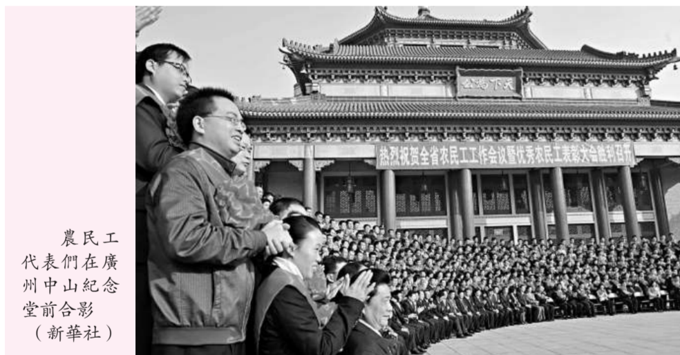
農民工代表們在廣州中山紀念堂前合影

作為農民工最多且來源範圍最廣泛的省份，廣東召開此次會議要求全省，當前和今後一個時期在農民工作方面要深入貫徹落實科學發展觀，以解放思想、深化改革為動力，以穩定就業、提升技能、維護權益、強化社保為重點，加快推進農民工基本公共服務均等化，努力爭當全國農民工工作的排頭兵，為全省經濟社會科學發展做出新貢獻。