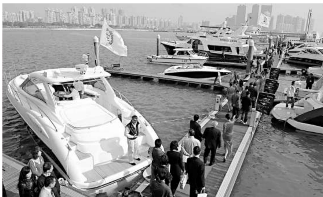
中國的遊艇產業日漸成熟，珠海欲將其發展成為支柱產業(資料圖片)