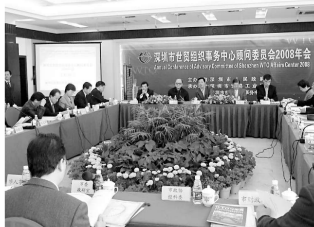
深圳WTO顧問委員會年會為深圳企業獻良策

面對日趨嚴峻的貿易形勢，中國企業所受到貿易糾紛亦會增多。深圳WTO中心今年加強了對WTO人才培育，今年完成了5家WTO定點培訓機構認定，並根據各區企業分布與產業結構特點，「送知識下鄉」舉辦多場關於應對反補貼調查、美國337調查、歐盟技術性貿易措施的培訓與宣講。