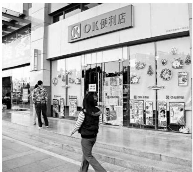
OK便利店全線退出東莞市場，12家門店均關門停業

港元。此次OK便利店全線退出東莞市場，是該公司股權結構調整之後的第一次大舉動。時下金融海嘯正席捲全球，公司高層選擇縮小投資規模過冬。據了解，利亞零售近日以1500萬人民幣收購廣州糧食集團轉讓25%的OK便利店股權，目前利亞在華南公司中的股份已增至98.5%。利亞零售高層此前就曾透露，增持股份後，擁有更大自主權的利亞將更自主訂訂拓展及管理廣東省便利店業務的策略，進一步提升經營效率。