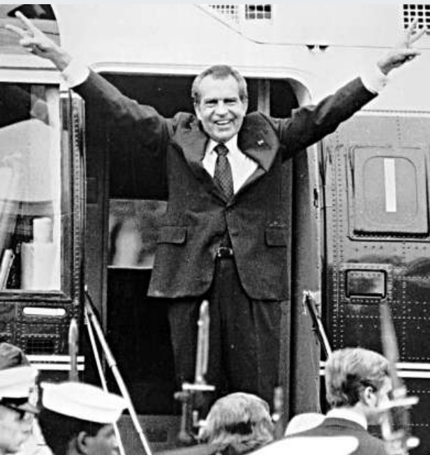
水門事件迫使美國總統尼克松辭職