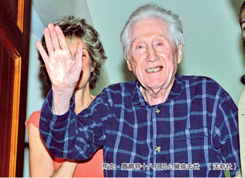
馬克·費爾特十八日因心臟病去世