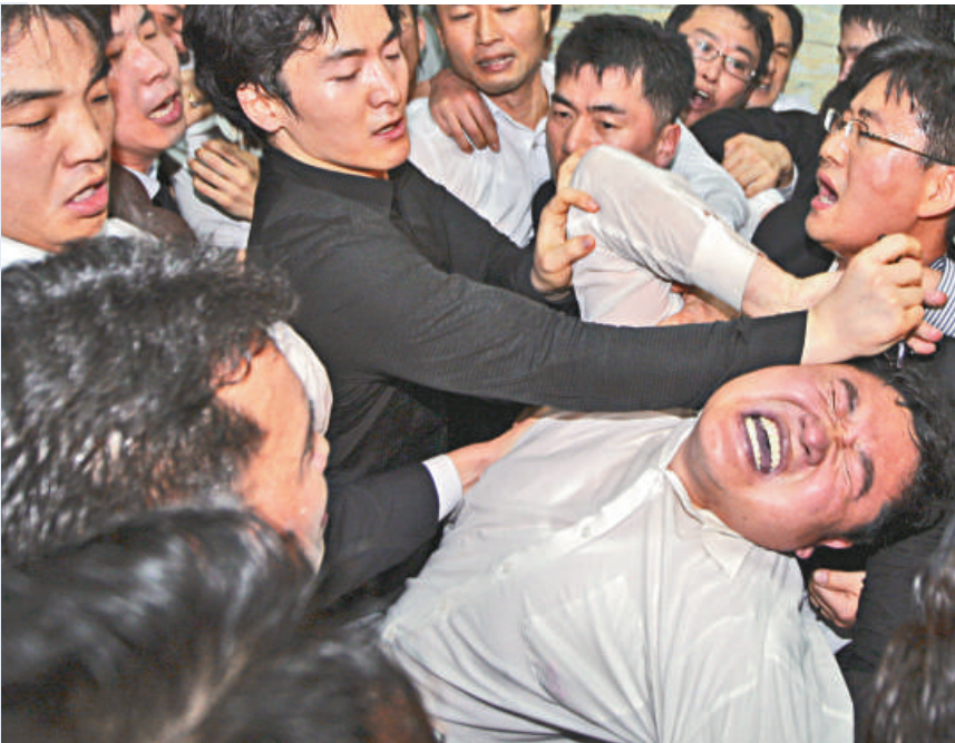
韓國國會上演了一場群毆戰，兩派議員為韓美自貿協定在國會大打出手

韓國國會群毆，已經不是第一次出現。去年十二月中旬，韓國國會議員因一項彈劾檢察官的提案而發生大規模群毆。