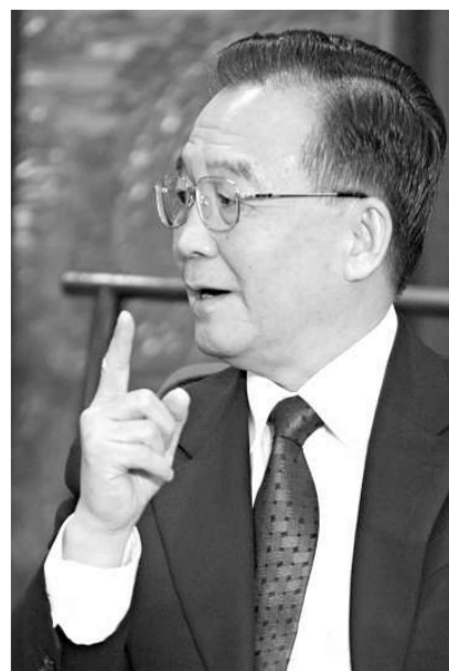
溫家寶總理說：祖國永遠是香港的堅強後盾