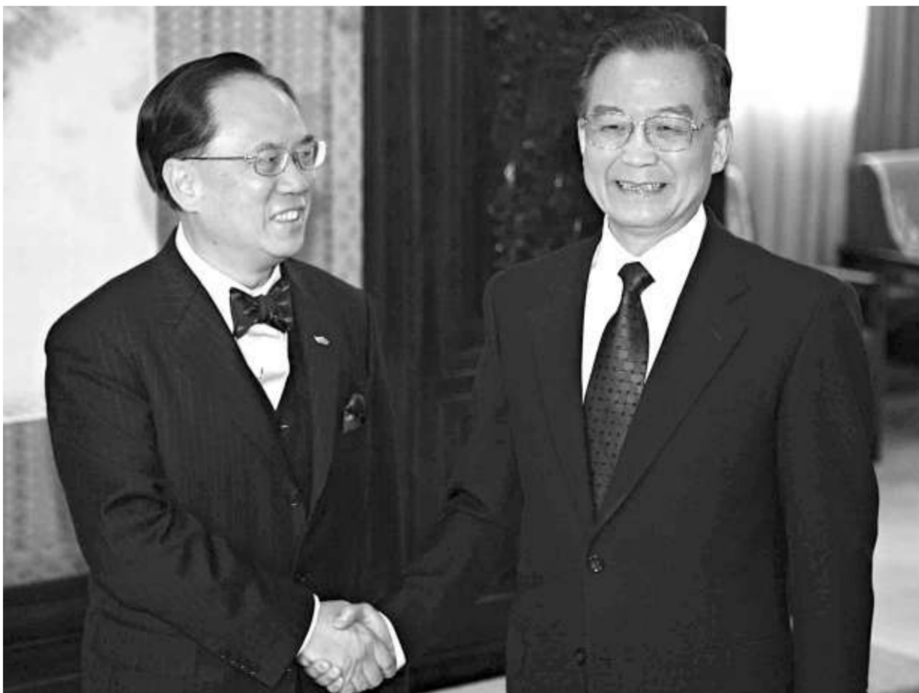
行政長官曾蔭權昨日在北京向國家主席胡錦濤匯報香港經濟、社會和政治發展的最新情況

曾蔭權還談到溫家寶總理在俄羅斯訪問時、在廣東考察時都把香港的事記掛心上；在曾蔭權參加APEC會議期間，胡錦濤主席也十分關心香港應對金融海嘯的情況，給予香港很大的鼓勵和支持。最後，曾蔭權再次感謝中央對香港的支持及關注，並表示會小心聽取每一項助港措施及落實時間。