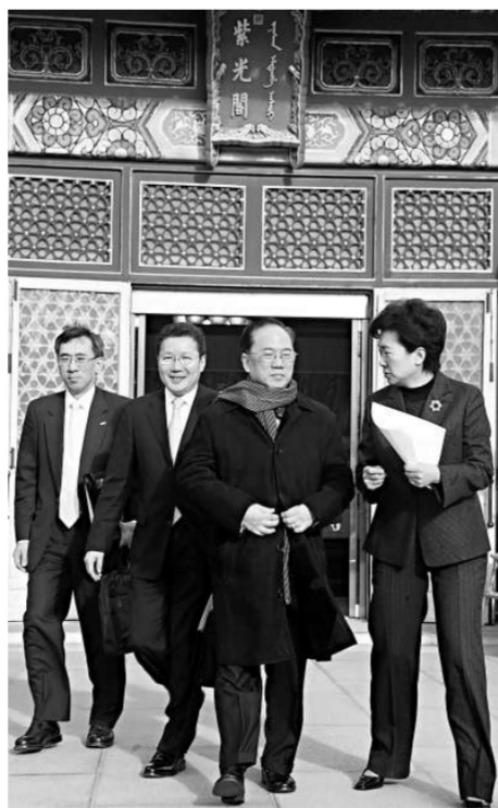
行政長官曾蔭權到北京中南海紫光閣向國務院總理溫家寶述職

香港工業總會主席陳鎮仁表示，中央政府推出的措施可以強化香港抵禦金融海嘯的能力，對穩定香港的經濟，振奮民心，保障市民就業，協助企業升級轉型，有十分正面的作用。他認為，行政長官在香港經濟困難時期，向中央提出兩地雙贏的方案，顯示他積極帶領香港克服挑戰。