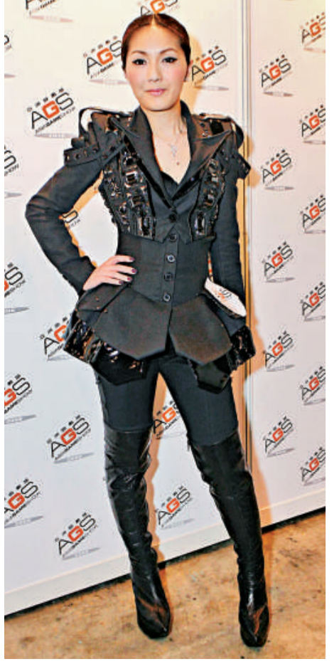
▲千嬅穿上七吋高跟鞋出席遊戲展