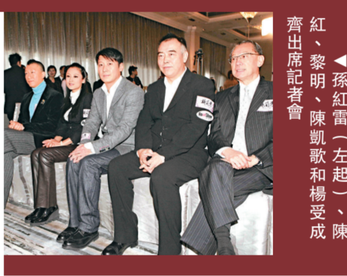
紅、黎明、陳凱歌和楊受成齊出席記者會