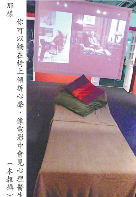
▲你可以躺在椅子上傾訴心聲，像電影中會見心理醫生那樣

表示，這個展覽去年於柏林首次展出後，很受觀眾歡迎，之後曾移師往美國的洛杉磯及奧地利維也納展出，香港是第四站。 姬絲汀·雅思柏介紹說，非常巧合地，心理分析學與電影是同於二十世紀初出現，並且互相影響。展覽隨著兩者發展的步伐，介紹彼此之間的關係。早在電影出現之前，攝影師隆德以定時攝影的手法紀錄歇斯底里病人的發病過程，不過，這些相片要求病人要固定某個姿式、動作，以遷就攝影師當時較慢的捕捉器材，因此被質疑是否真實紀錄。展品中的一系列連串圖片，便是當時所拍。