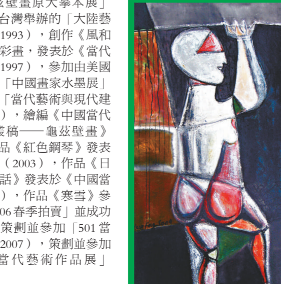
▲陳方方作品：重彩《人體》99x52cm