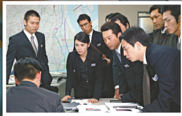
▲電影版較多描述警署內的工作情況