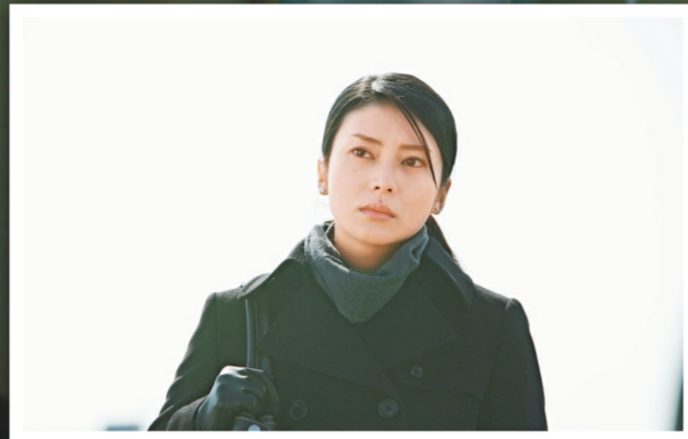
▲柴咲幸在片中飾演刑警