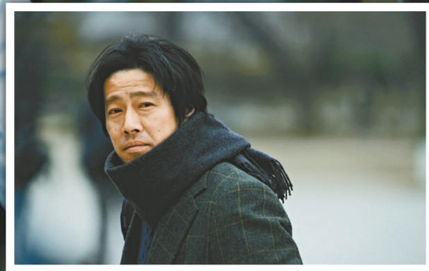
▲堤真一在片中的造型以至演技，堪稱一絕