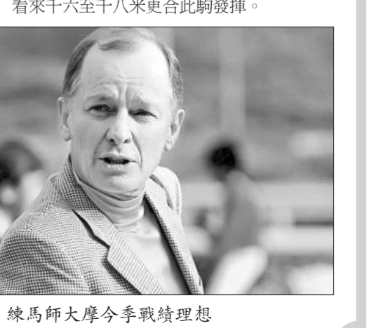
練馬師大摩今季戰績理想